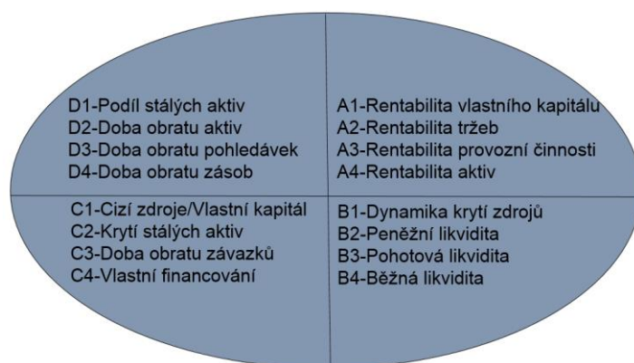
Obrázek 1 - Kvadranty grafu Spider analýzy