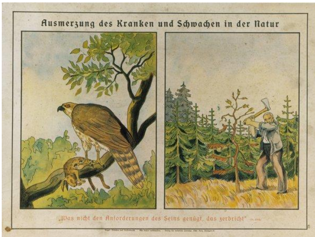
Obr. 4: Plakát „Poučení z přírody“ (Institut Tereziánské iniciativy Tiráž, online)