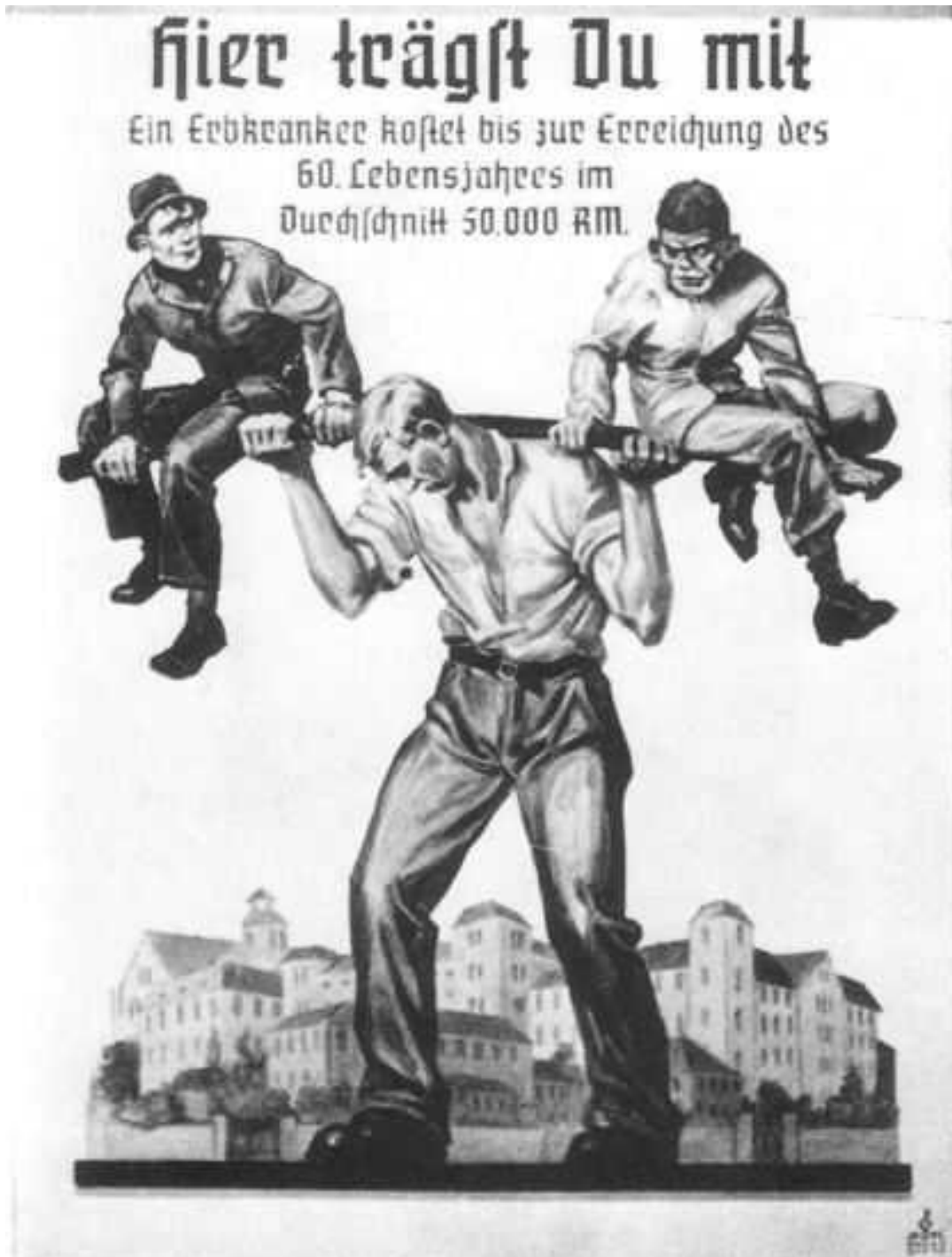
Obr. 1: Plakát upozorňující na finanční zátěž péče o dědičně nemocné (Palba.cz, online, 2005)