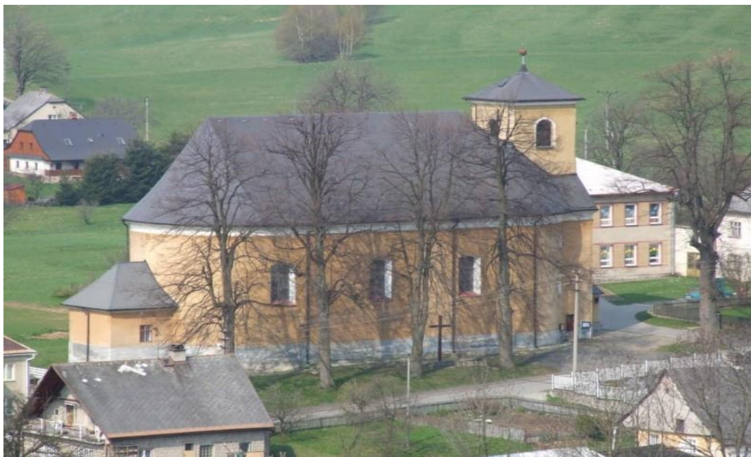
Příloha č. 7. Kaple Sboru českých bratří.