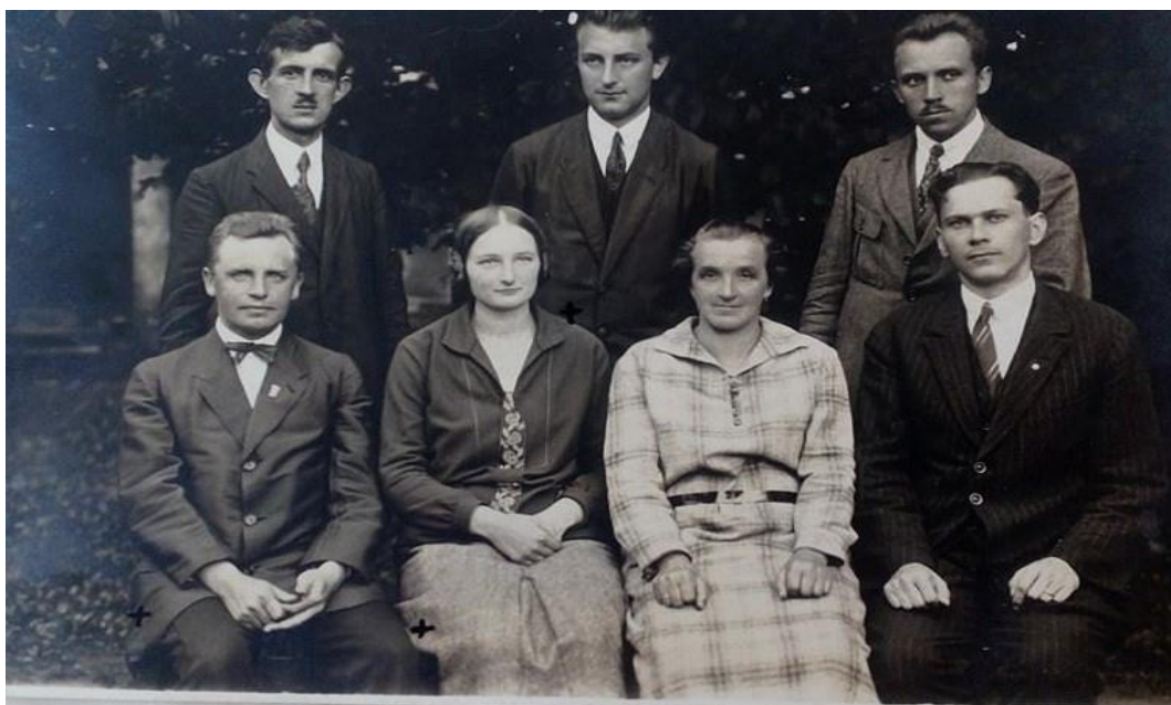
Příloha č. 1. Učitelský sbor z roku 1925. Kronika Obecné a měšťanské školy v Písařově, 1919-1933.