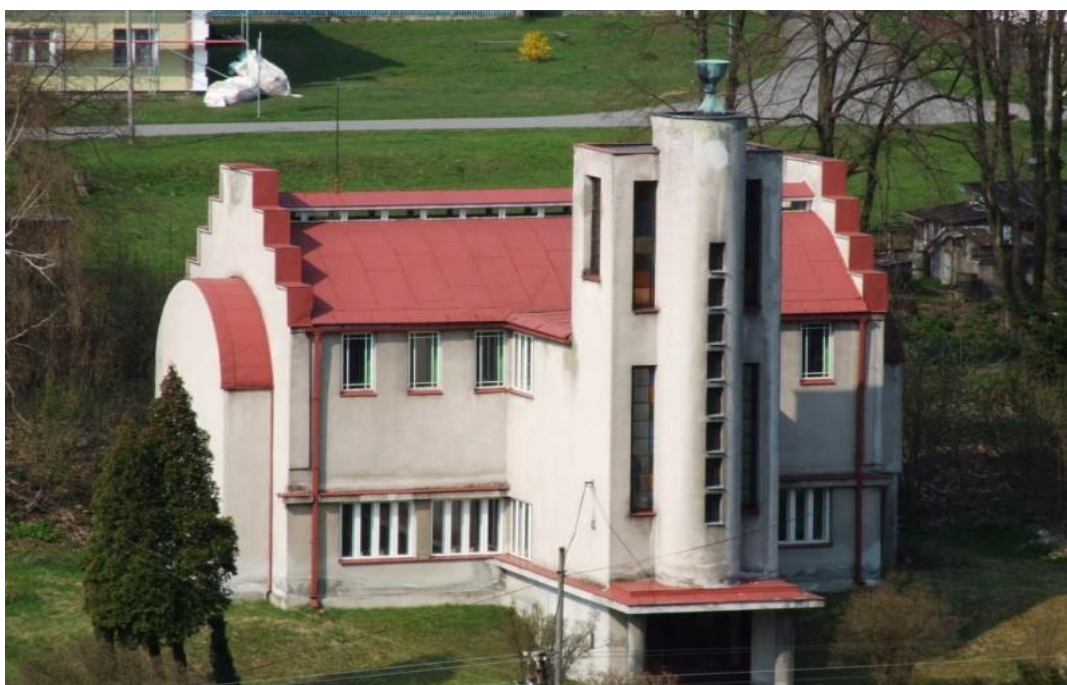
Příloha č. 8. Kostel církve česko-bratřské (postaven 1933).