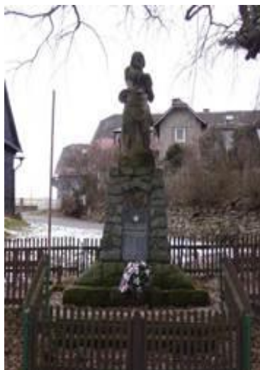
Pomník obětem obou světových válek.

Pomník byl odhalen v roce 1923. Na desce jsou uvedené jména všech padlých. Jde o dílo sochaře J. Pelikána z Olomouce.