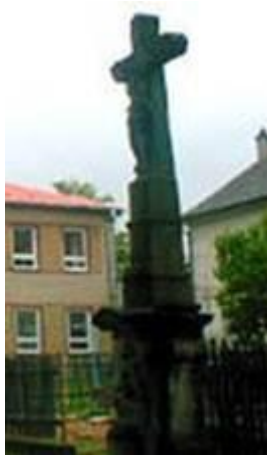
Kamenný kříž u dolní školy.