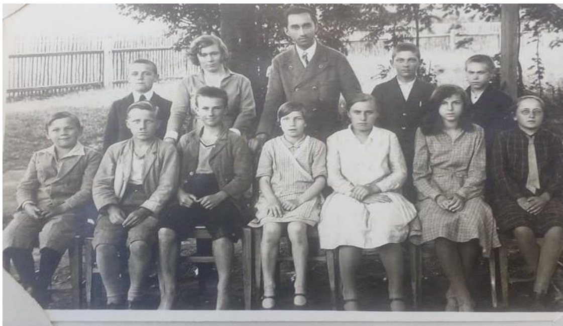
Příloha č. 2. Žáci II. ročníku rok 1930. Kronika Obecné a měšťanské školy v Písařově, 1919-1933.