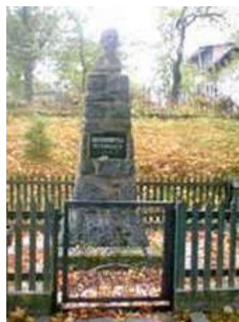
Pomník T. G. Masaryka