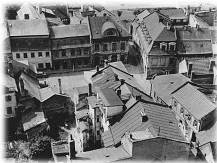
Obr. č. 2 – Pohled z věže farního chrámu na židovskou čtvrť.

(CYDLÍK, T. a kol. Historie a současnost podnikání na Prostějovsku . Žehušice: Městské knihy, 2009. s. 19)