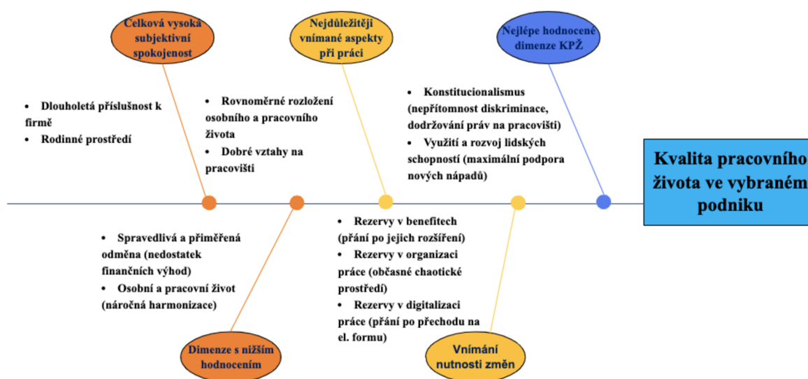
Obrázek 1 Ishikawův diagram příčin a následků

Výše zmíněné poznatky a analýzy jsou přehledně zobrazeny v následujícím Ishikawo diagramu. Tento diagram je konstruován tak, aby vizualizoval vztahy mezi různými složkami zkoumané problematiky a ukázal, jak jednotlivé příčiny mohou vést ke konkrétnímu následku (Hayes, 2023). Tímto následkem je v tomto případě celková kvalita pracovního života ve vybraném mezinárodním podniku.