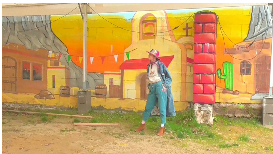
Škála kovbojů, statické snímky ze souboru videí, 2022