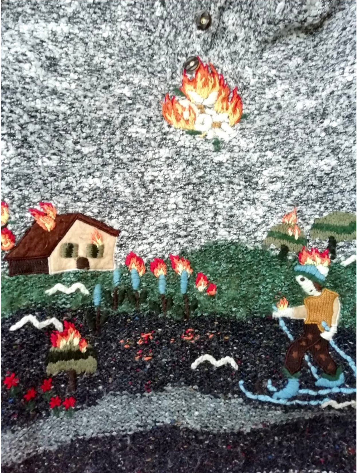
Bio topy, vyšíváné motivy na oblečení, 2022