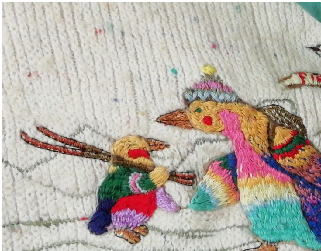
Bio topy, vyšívání motivy na oblečení, 2022