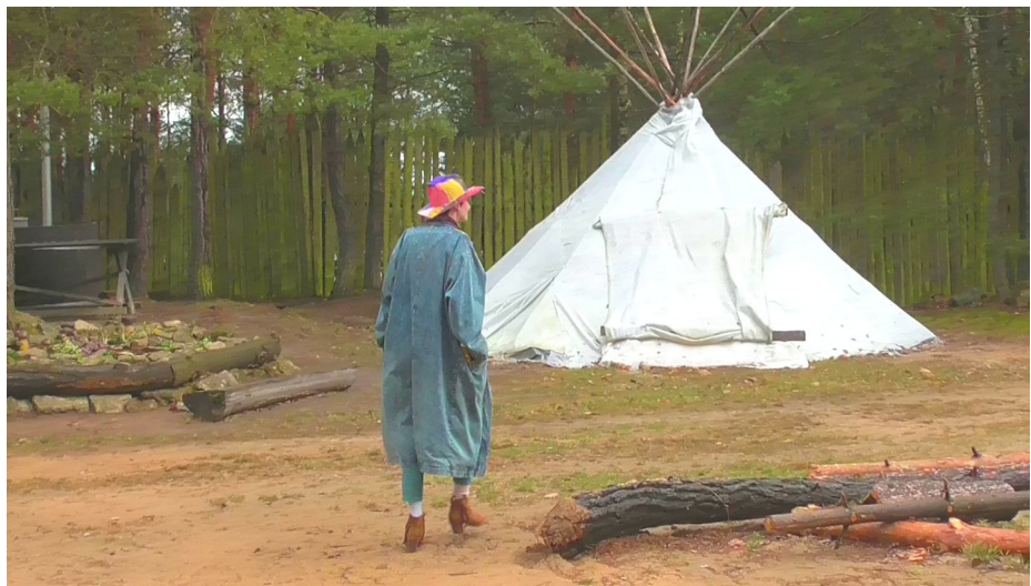
Škála kovbojů, statické snímky ze souboru videí (Trasa ve tvaru lasa) 2022