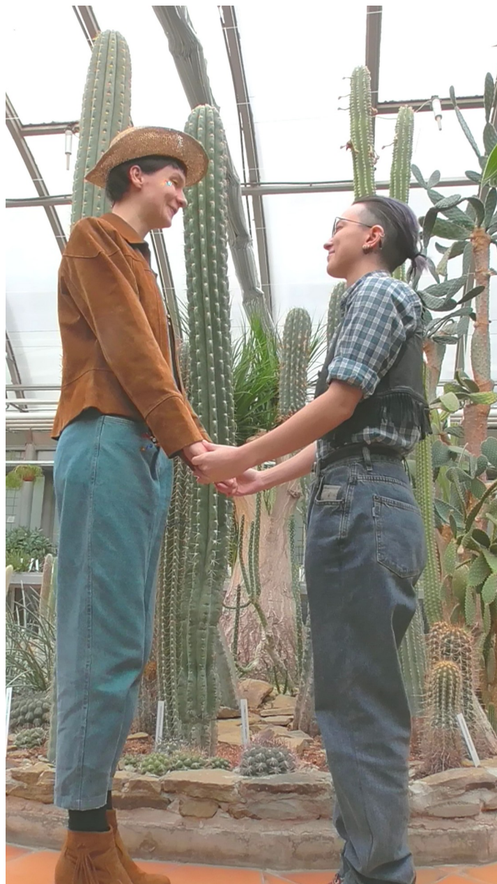
Škála kovbojů , statický snímek z videa (Pokvířený country tanec) 2022