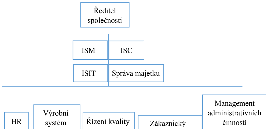
Graf 1: Organizační schéma společnosti XY

Následující graf ukazuje organizační schéma společnosti XY.