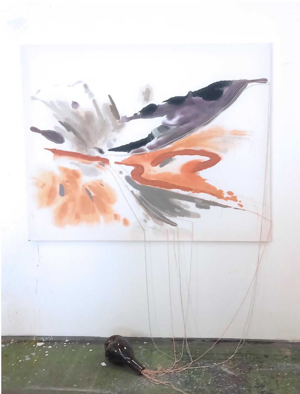
Blízkost šera; prošívaná malba na textil, 130x160, 2023