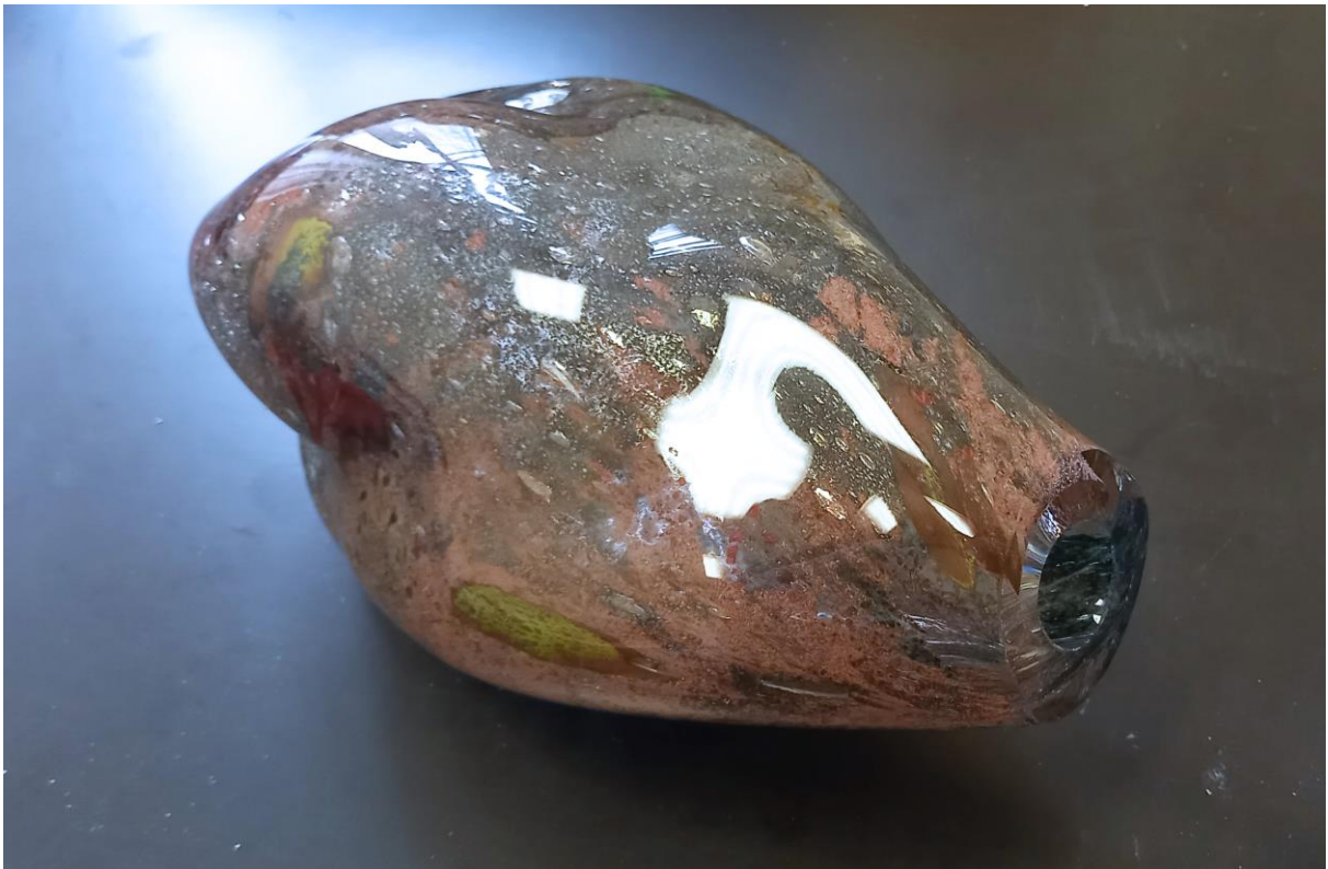
Kanopy; skleněné objekty; 2023