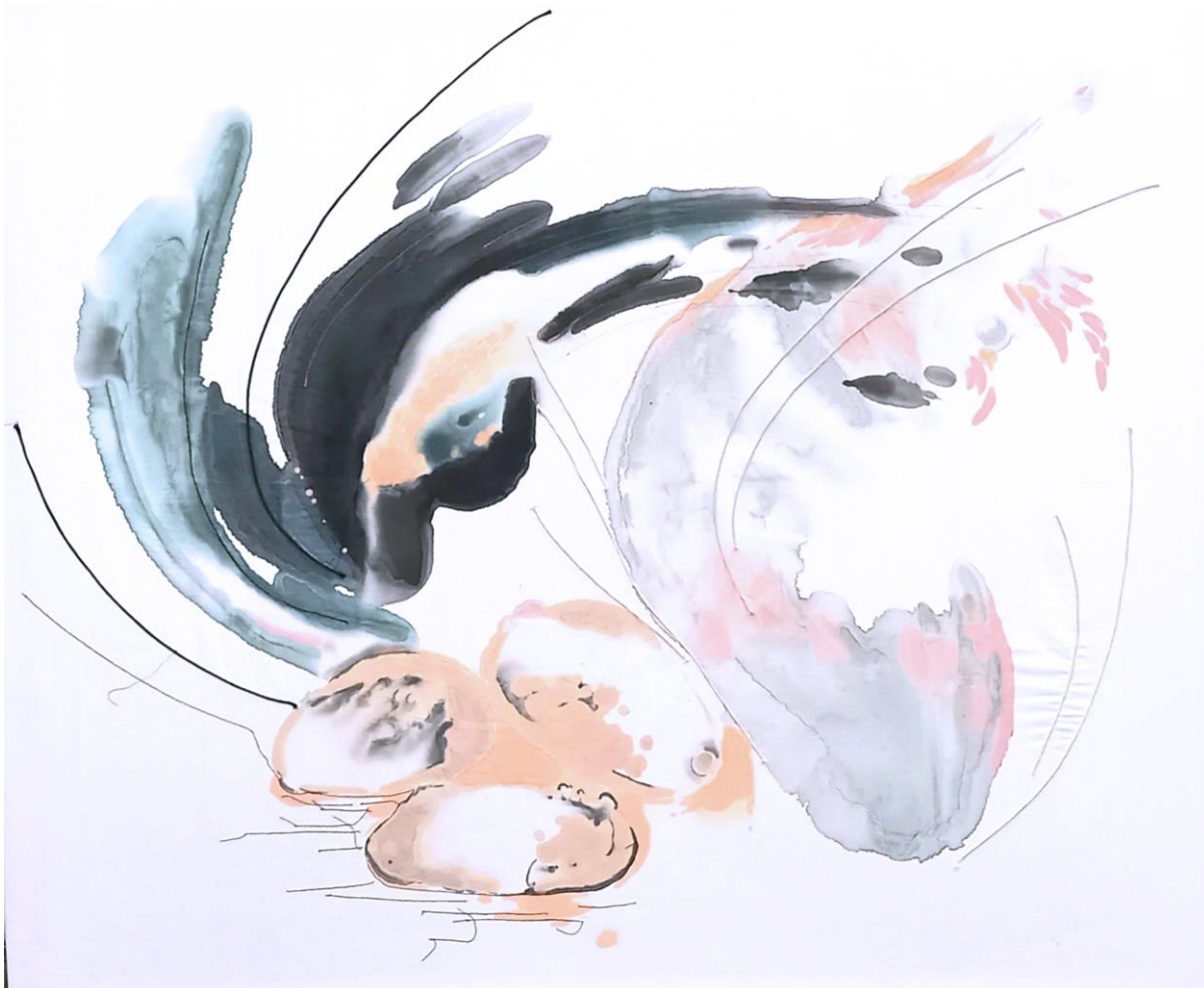
Tři vejce; prošívaná malba na textil, 130x150, 2023