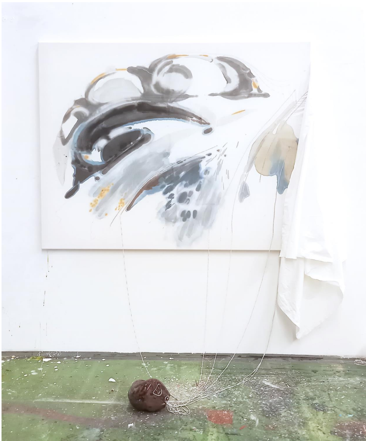
Jako minuty, co tečou; prošívaná malba na textil, 130x160, 2023