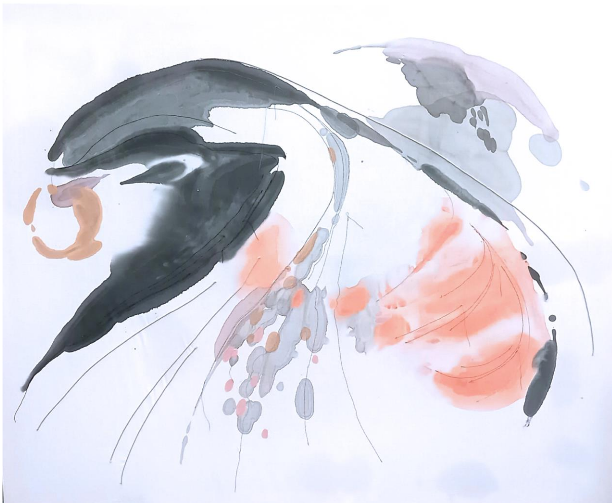
Dubulti; prošívaná malba na textil, 130x160, 2023