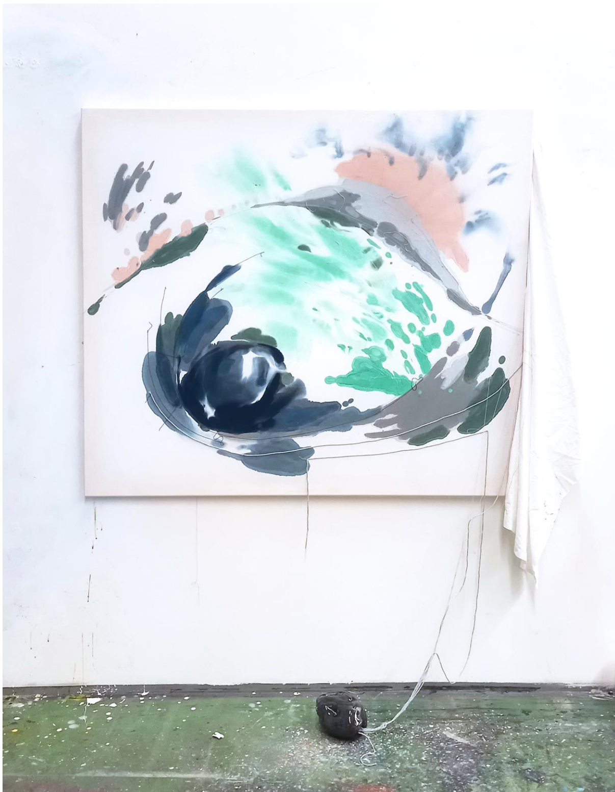
Balvaniště ; prošivaná malba na textil, 130x150, 2023