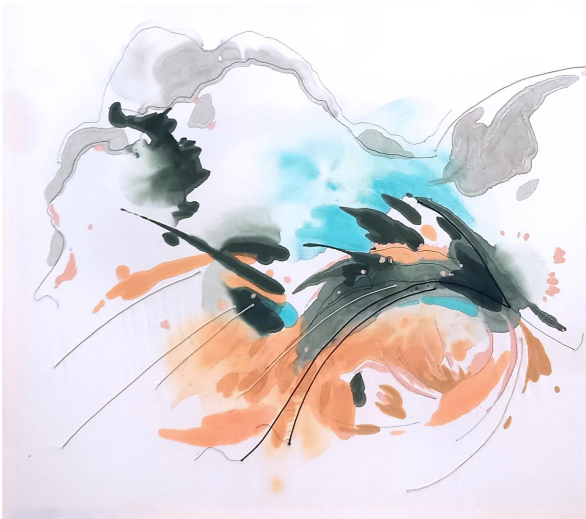
Bez názvu; prošívaná malba na textil; 130x150; 2023