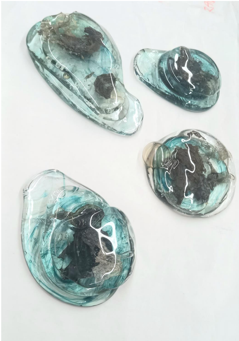
Drops; skleněné objekty se zataveným textilem; 40x25cm, 16x20cm, 15x22, 18x25; 2023