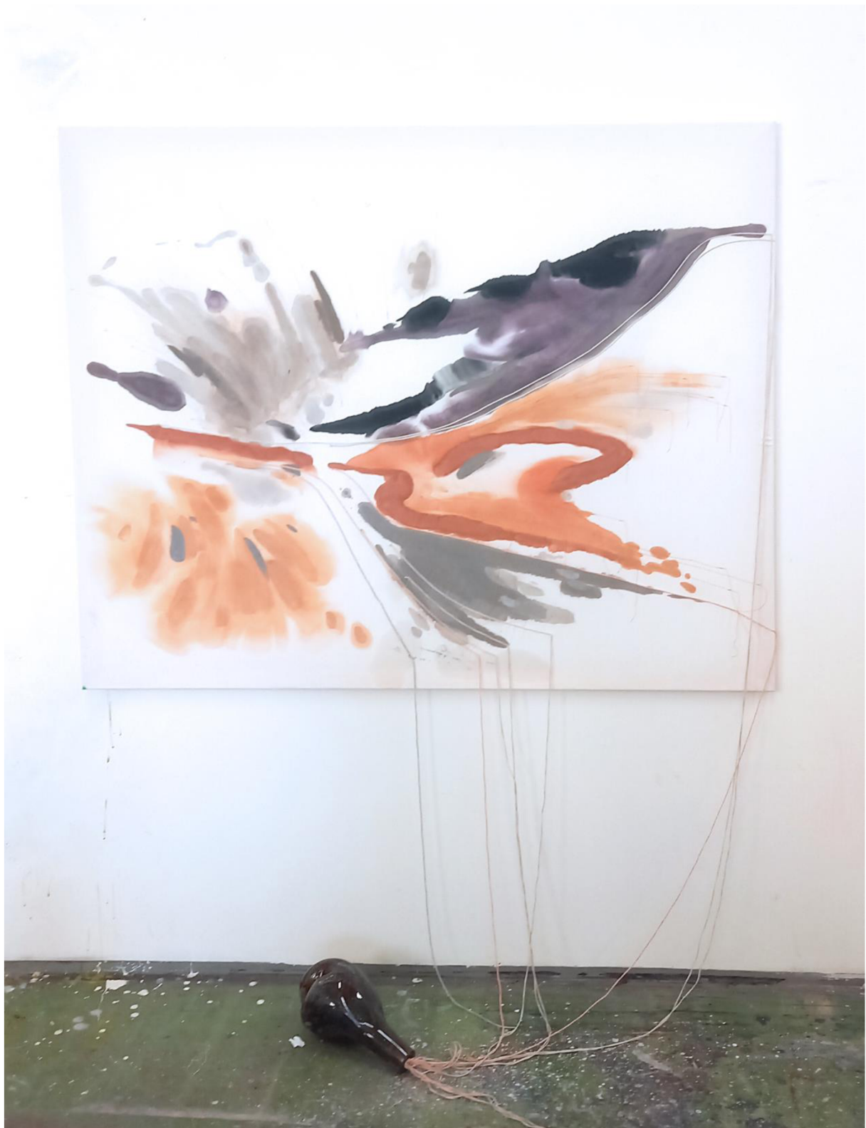
Blížkost šera; prošívaná malba na textil, 130x160, 2023