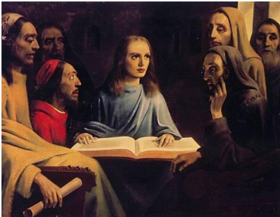
Christus in de tempel

Dus ontstond rond twee meter breed schilderij dat Han ongeveer van augustus tot half oktober 1945 heeft gemaakt. Met de voltooiing van het schilderij Christus in de tempel 7 waren “goeie tijden” voor Han beëindigd. De taak was voldaan. Het bleek dat Van Meegeren “slechts” een vervalsers is, maar toch steeds een misdadiger (hij bedroog en verdiende enorme bedragen door vervalsen) daarom moest hij tussen de maanden november en december naar fort Blauwkapel 8 overgebracht worden. Ten opzichte van de voorwaarden die in het Bureau aan de Herengracht heersten moest deze nieuwe plek voor Han echt een grote schok zijn. Geen privéleven onder andere delinquenten, en dit gezelschap was niets voor hem maar misschien was het voor hem beter dan alleen zonder menselijk contact in cel zitten. Blijkbaar was hij daar rond de twee maanden vastgehouden.