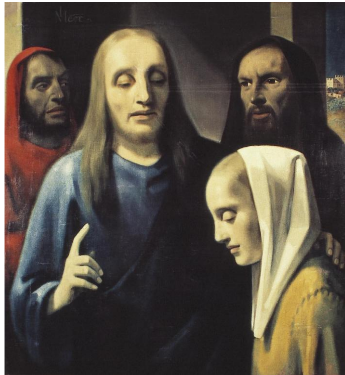
Christus en de overspelige vrouw