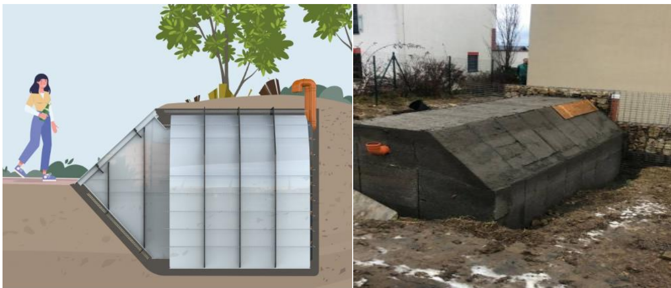
Obrázek 2 – Quick 1 – sklep a úkryt k obetonování

Ize provést svépomocí, tedy náklady by byly takřka nulové, kromě investovaného času. Následné uzpůsobení si prostor je libovolné. Výhodou je právě fakt, že se jedná především o sklep, tedy za mírového stavu, nebo za stavu, kdy nehrozí žádné přírodní katastrofy má dané využití.