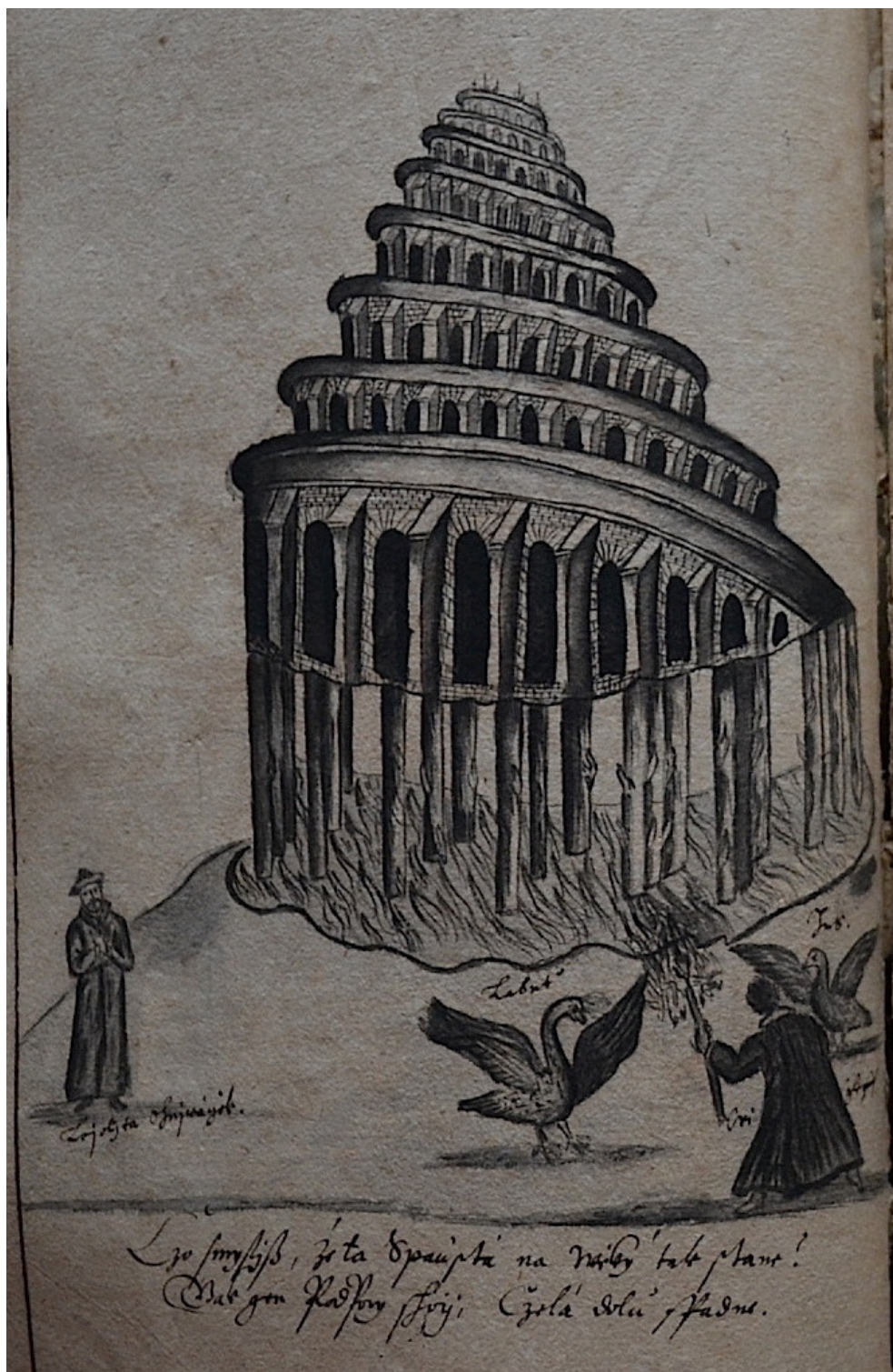
Příloha 3a) Celé vyobrazení z Historie církevní