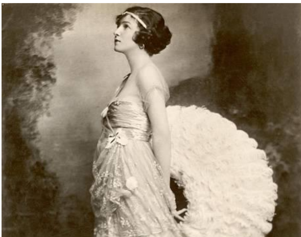
(39) Obrázek 1 – Dancing Legend Irene Castle .

války stále nosily sukně až k zemi, na evropskou scénu přináší Coco Chanel pohodlnější dámskou volnočasovou módu inspirovanou pánskými střihy. Na oděvu se tak odrážely ženské snahy o emancipaci, zrozené za války. Roztomilost a plachost přestávala být ceněná. Ženy si postupně osvojují činnosti dosud vyhrazené mužům a spolu s těmito aktivitami se jim připodobňují i vzhledově. Nově tak navštěvují dokonce pánské krejčí. Nadále se zkracovaly sukně i vlasy na tzv. bubikopf po vzoru tanečnice Irene Castle, která se v roce 1918 objevila i na titulní stránce Vogue . Ženy tak odvážně shazují své koruny krásy, jak vlasy vnímala renesance. Ideálem se stává vyhublá chlapecká postava bez výrazných křivek a dlouhá šíše. Starší neprovdaná žena s sebou přestává nést negativní konotace „staré panny“, nově je vnímána jako svobodná.