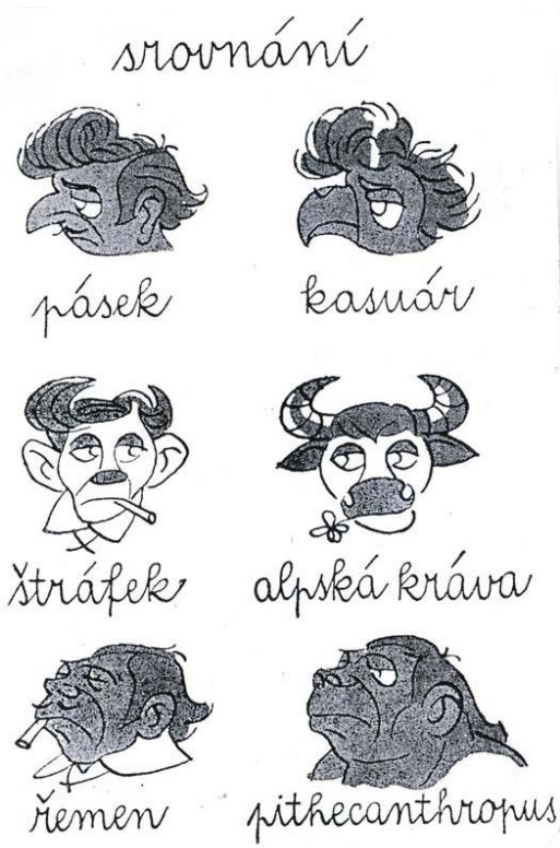
(55) Obrázek 3 – Srovnání páska

filmových pláten byla zřejmá, z hudebních přenašečů si potápkové osvojovali hrubší a ležerní mluvy po vzoru jazzových zpěvaček.