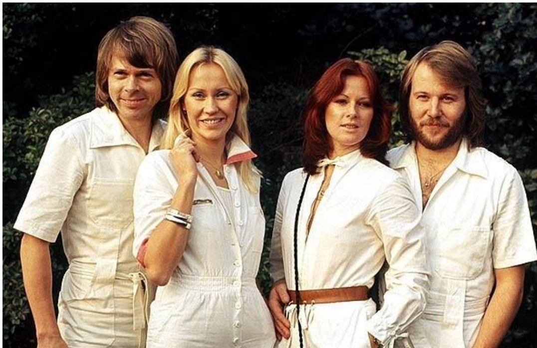
(94) Obrázek 7 – ABBA in 1977

tak tedy otázka, zda je vůbec možné v této reprezentaci nacházet něco autentického . Tato píseň, a i jiné jí podobné, zůstává dle mého názoru spíše vpuštěním do jakéhosi pomyslného života členů kapely, ne do toho reálného. Pro mě je to především dílek skládačky jejich utvářené image .