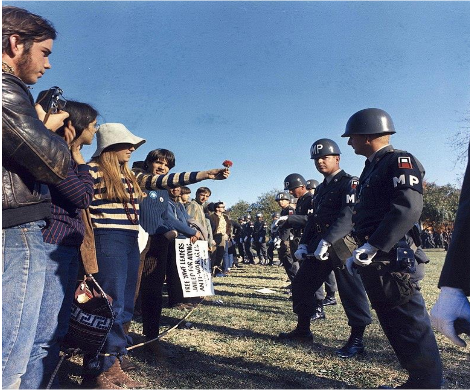
(88) Obrázek 7 – A female demonstrator