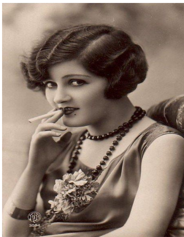
(41) Obrázek 2 – Zelda Fitzgerald in her „flapper“ attire

„mužské“. (40) Dosud byly ženy z hlediska genderové role spojovány především s domovem, péčí o děti a domácnost, navíc s něžnými „typicky ženskými“ vlastnostmi. Tehdejší chápání genderu se téměř bez rozdílu překrývalo s biologickým pohlavím. Až dosud jsme byli svědky prohlubování rozdílů šatníků mužů a žen, co do barvy, střihů i praktičnosti, ještě ve středověku by jakékoliv záměny mimo karneval byly trestány. Pokud se někde objevily nepatrné ústupky jistě tomu nebylo z emancipačních důvodů, ale kvůli praktičnosti, důkazem mohou být například jezdecké kostýmky. První světová válka a nutnost zjednodušení pracovního oděvu však pootevřela dveře emancipačním snahám žen. Krása a pečovatelské vlohy přestávají být jedinými kvalitami žen oceňované ve společnosti. Během války a po jejím skončení dámy odkládají korzety a místo nich volají po zaměstnání vzdělání, v neposlední řadě ale i po zábavě, cigaretou v ruce usedají za volanty automobilů a ztělesňují tak křesťanské pojetí „smyslné a zrádné“ ženy jakožto nástroje ďábla. Dochází k prvnímu stírání společenských rozdílů mezi ženou a mužem, což se odráží i v rozdílech mezi jejich šatníky.