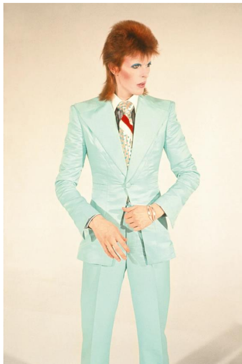
(98) Obrázek 9 - David Bowie