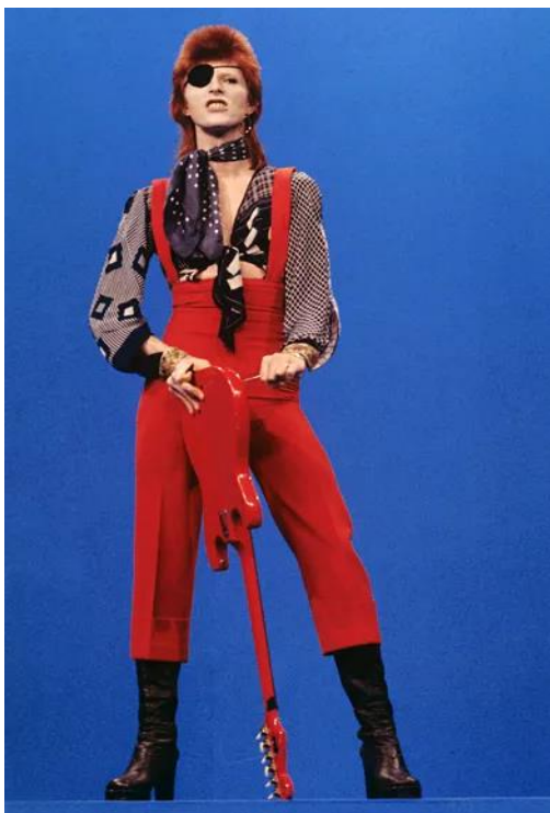
(97) Obrázek 8 - David Bowie.