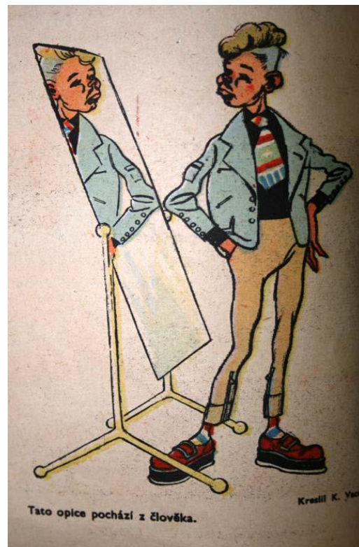
(56) Obrázek 4 – Pásek

Podobnost vnějšího stylu je poměrně snadno prokazatelná, to, zda jsou ale stejně prokazatelné i životní hodnoty a (ne)politické záměry příslušníků subkultur, už tak skálopevné není. Odlišnost módního stylu je často za podpory soudobých médií slučována s odlišností, lépe řečeno nesprávností hodnot, chování a morálky. A právě takové případy vytváří ideální půdu pro zahájení hysterie v médiích i ve společnosti. „Ve většině případů přilákají pozornost médií nejdříve stylistické inovace subkultury. Následně jsou policií, justicí a tiskem ‚objeveny‘ deviantní nebo ‚protispolečenské‘ činy – vandalismus, klení, bitky, ‚zvířecí chování‘ -, a ty poslouží k ‚vysvětlení‘ původního překročení zvyklostí v oblékání.“ (57) U subkultur může docházet ke střetu dvou odlišných významových rovin, a to významů, které se subkultury opravdu vědomě či nevědomě sdělují, a významů, které my jako příjemci čteme a interpretujeme. Image subkultury se zde tříští mezi image tvořenou jejími příslušníky a image subkultury tvořenou jejím okolním, subkulturami podobnými i zcela odlišnými. Pochopitelně se zde dopouštím