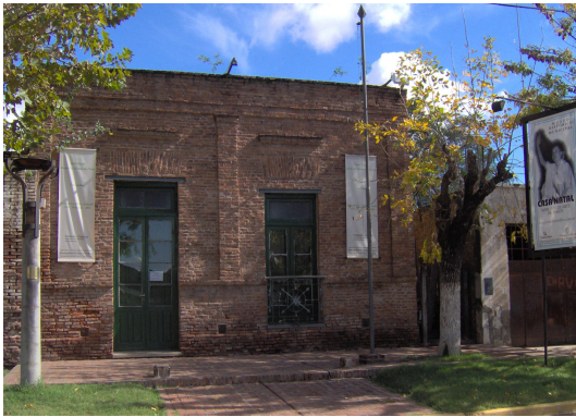
Imagen 3 - la casa de Los Toldos