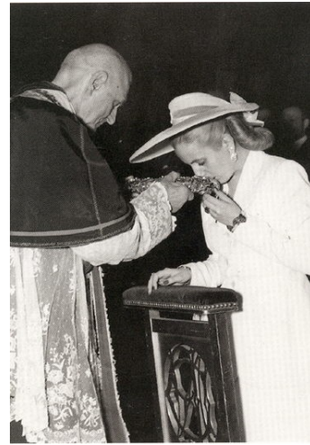
Imagen 8 - Eva con el Papa