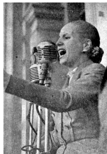
Imagen 6 - un discurso desde la Casa Rosada