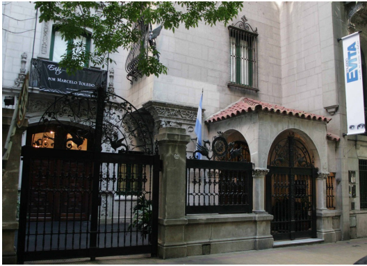
Imagen 13 - el Museo de Evita en Buenos Aires