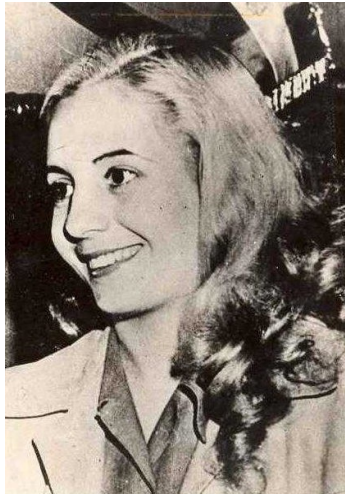
Imagen 1 - Evita