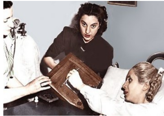
Imagen 10 - votando en el hospital