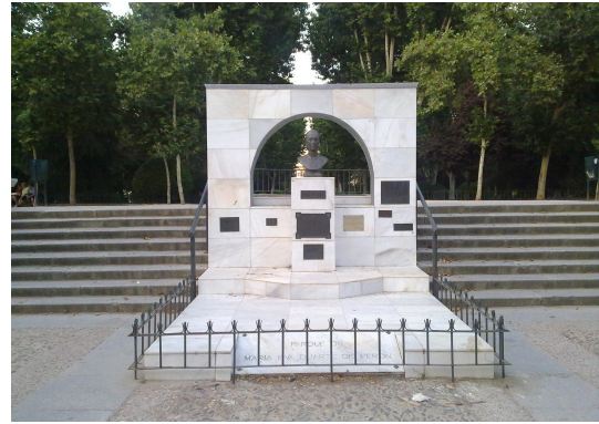
Imagen 14 - el monumento de Evita en Madrid