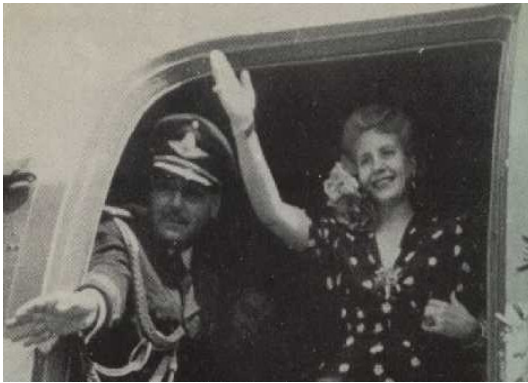
Imagen 9 - el viaje a Europa