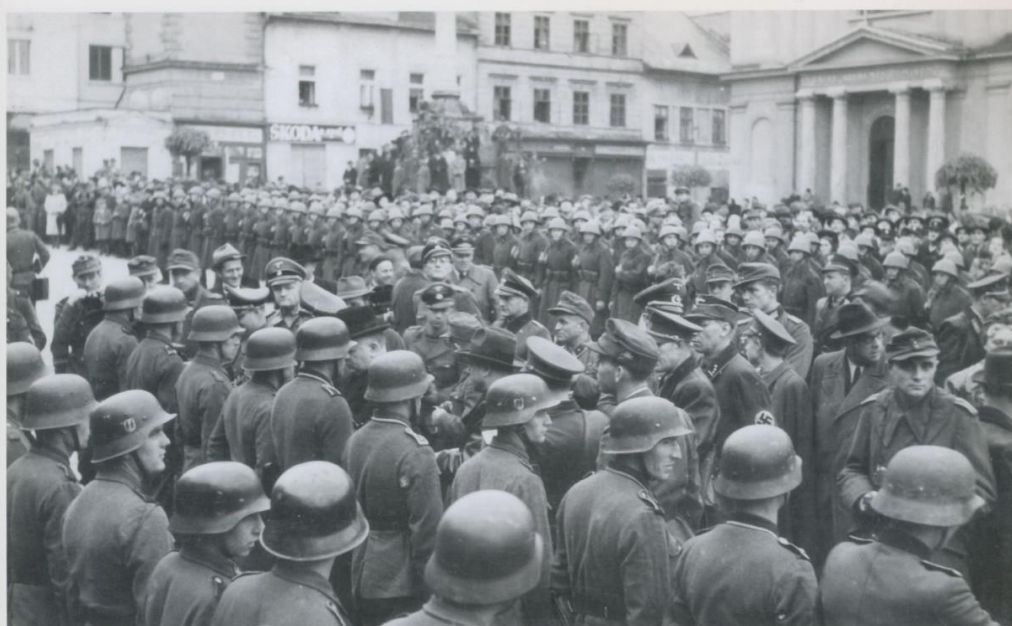
Nastúpené okupačné nacistické jednotky a 5. rota HG v Banskej Bystrici 30. 10. 1944