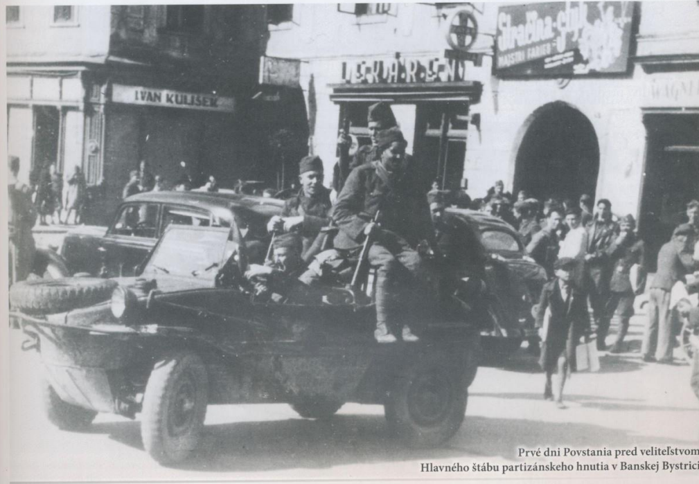
Prvé dni Povstania pred veliteľstvom Hlavného štábu partizánskeho hnutia v Banskej Bystrici