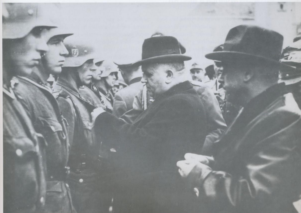
Prezident Jozef Tiso vyznamenáva nacistických okupantov v Banskej Bystrici 30. 10. 1944