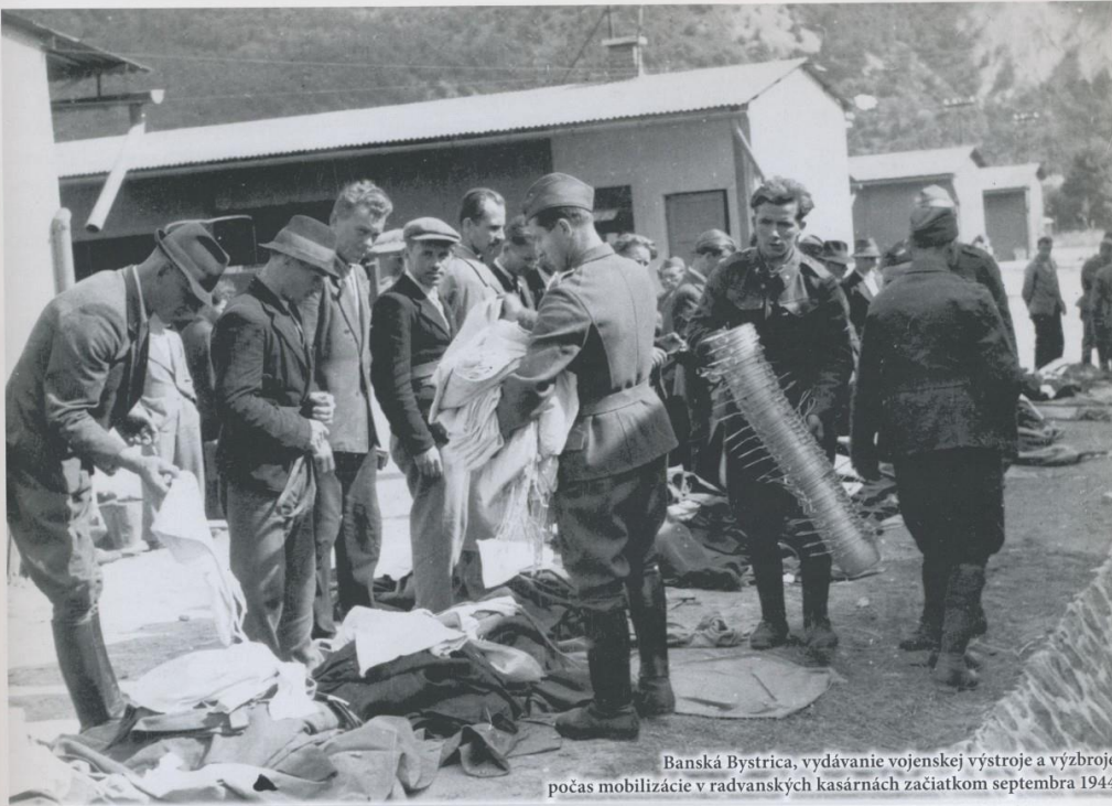
Banská Bystrica, vydávanie vojenskej výstroje a výzbroje počas mobilizácie v radvanských kasárnách začiatkom septembra 1944