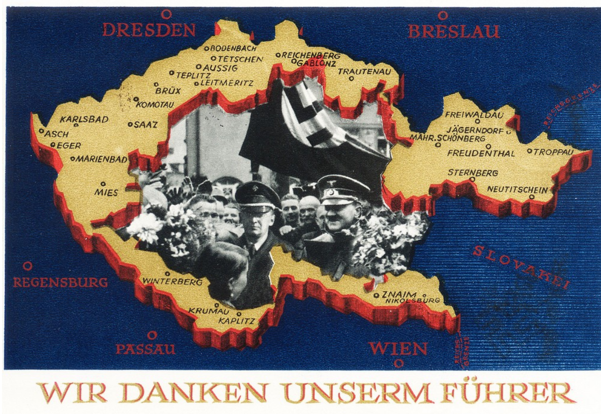
Příloha č. 3: Mapa českého pohraničí (Sudet) na dobové německé pohlednici 99