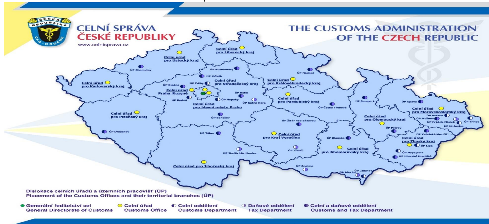
Příloha č. 1 Dislokace celních úřadů a územních pracovišť 123