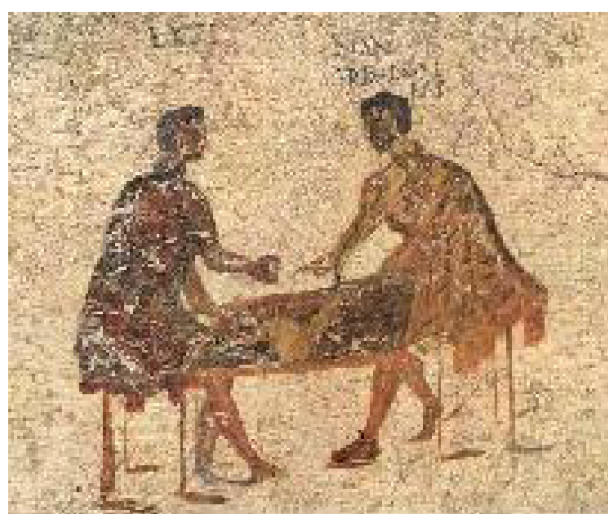
Obrázek 2.2: Freska ze zdi v Pompejích [9].