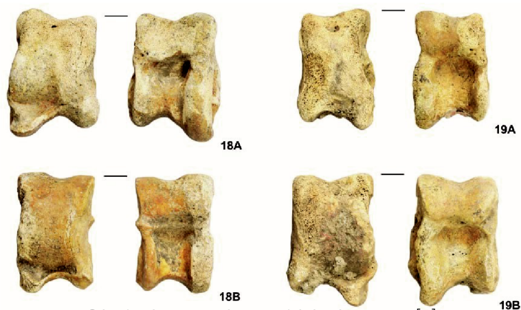
Obrázek 2.1: Hlezenní kůstky turu [8].

Nalezené kostky neměly jednotnou podobu, kolem roku 1400 př.n.l. se však ustálila dnešní podoba, tj. součet 7 na protějších stranách. Lidé ovšem nezůstávali pouze u šestištěnů. Mezi nalezené kostky patří i pravidelné čtrnáctistěny, osmnáctistěny, devatenáctistěny či dvacetistěny. V Egyptě byly nalezeny i kostky, jejichž strany byly zdobeny reliéfy bohů. Dá se tedy předpokládat, že tyto kostky sloužily při náboženských rituálech nebo k věštění, a tedy pomáhaly rozluštit vůli bohů, o kterých se lidé domnívali, že řídí jejich kroky a osud.