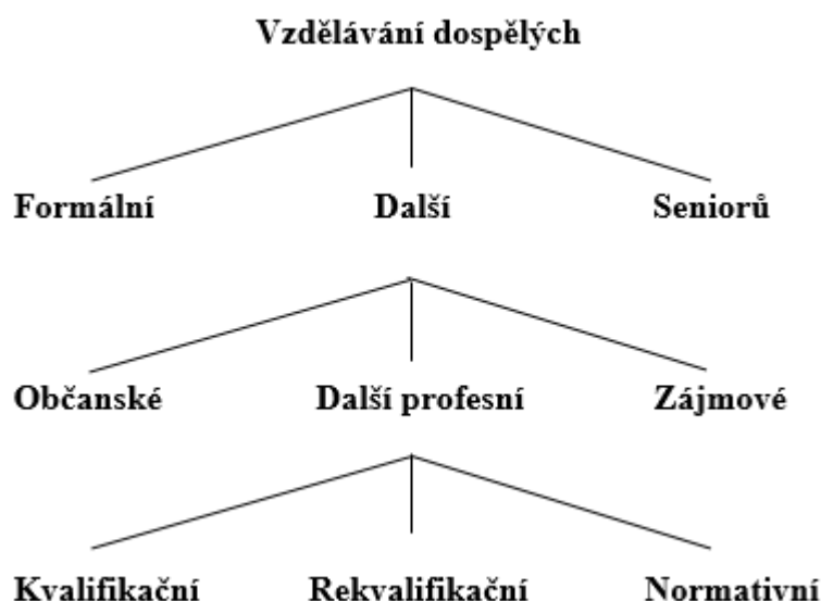
Obrázek 1: Schéma systému vzdělávání dospělých

Do systému vzdělávání dospělých pak zařazuje zájmové vzdělávání následovně: