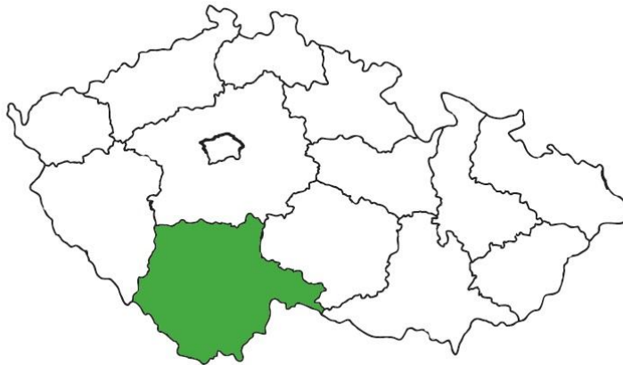
Obrázek 2: Region Jižní Čechy