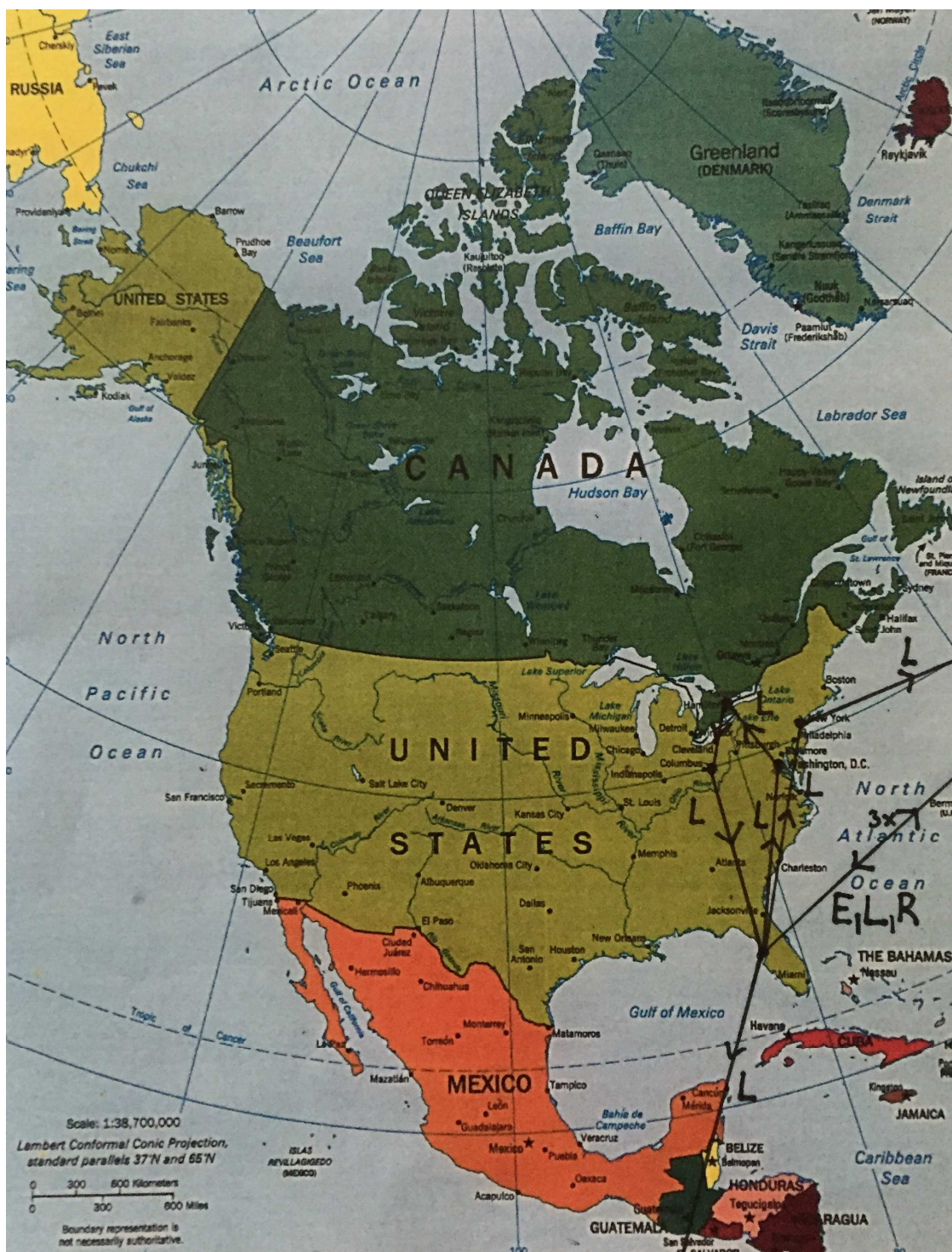
Obrázek č. 3- Mapa přeletů po Severní Americe. Upraveno podle [39]