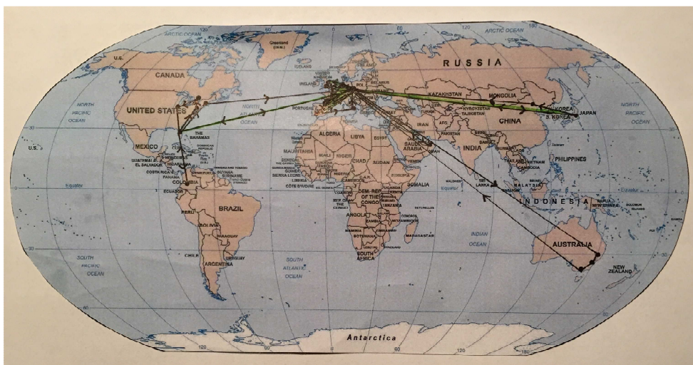
Obrázek č. 1- Mapa světa zobrazující veškeré přelety po dobu 1 roku. Upraveno podle [37]