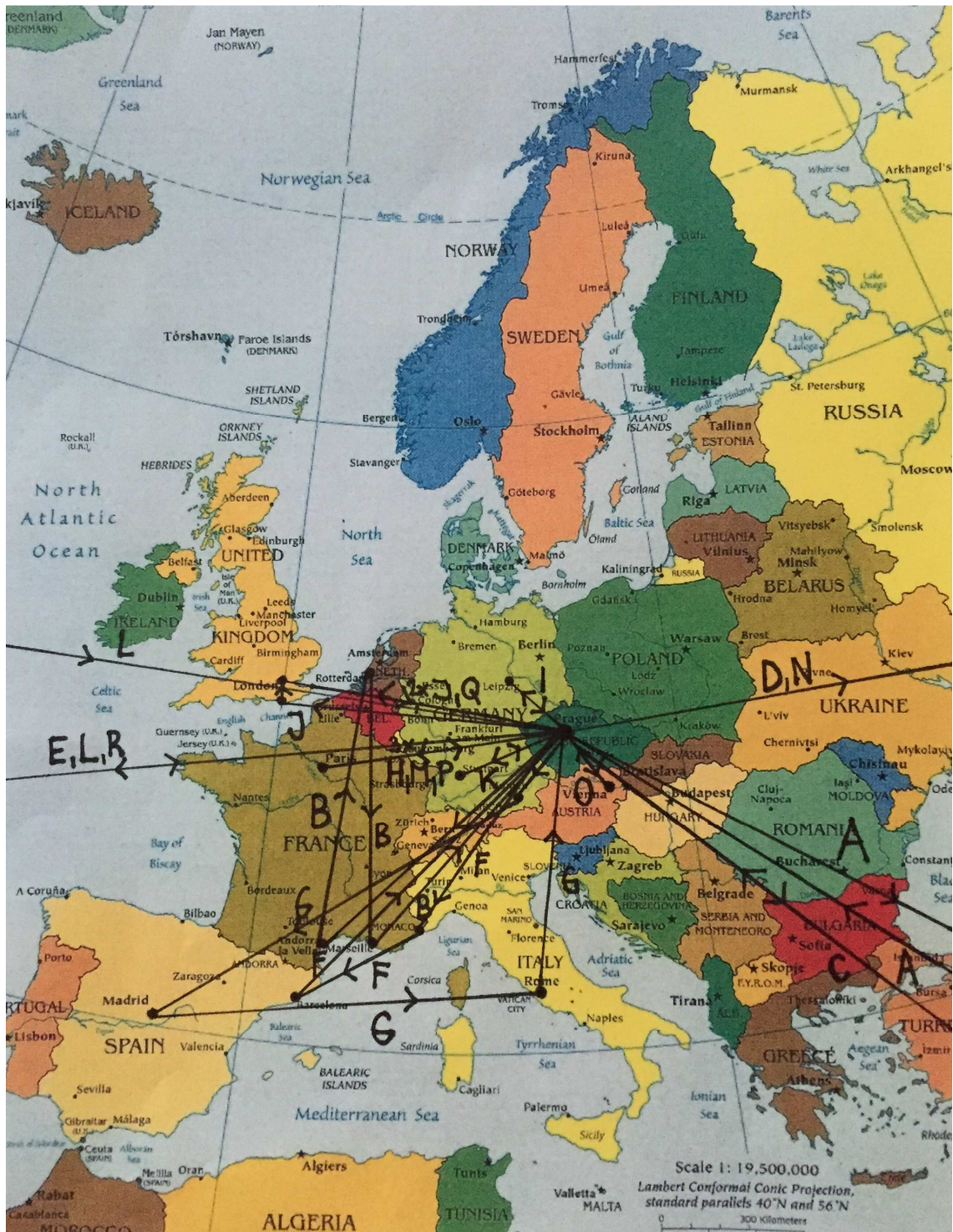
Obrázek č. 2- Mapa přeletů po Evropě. Upraveno podle [38]