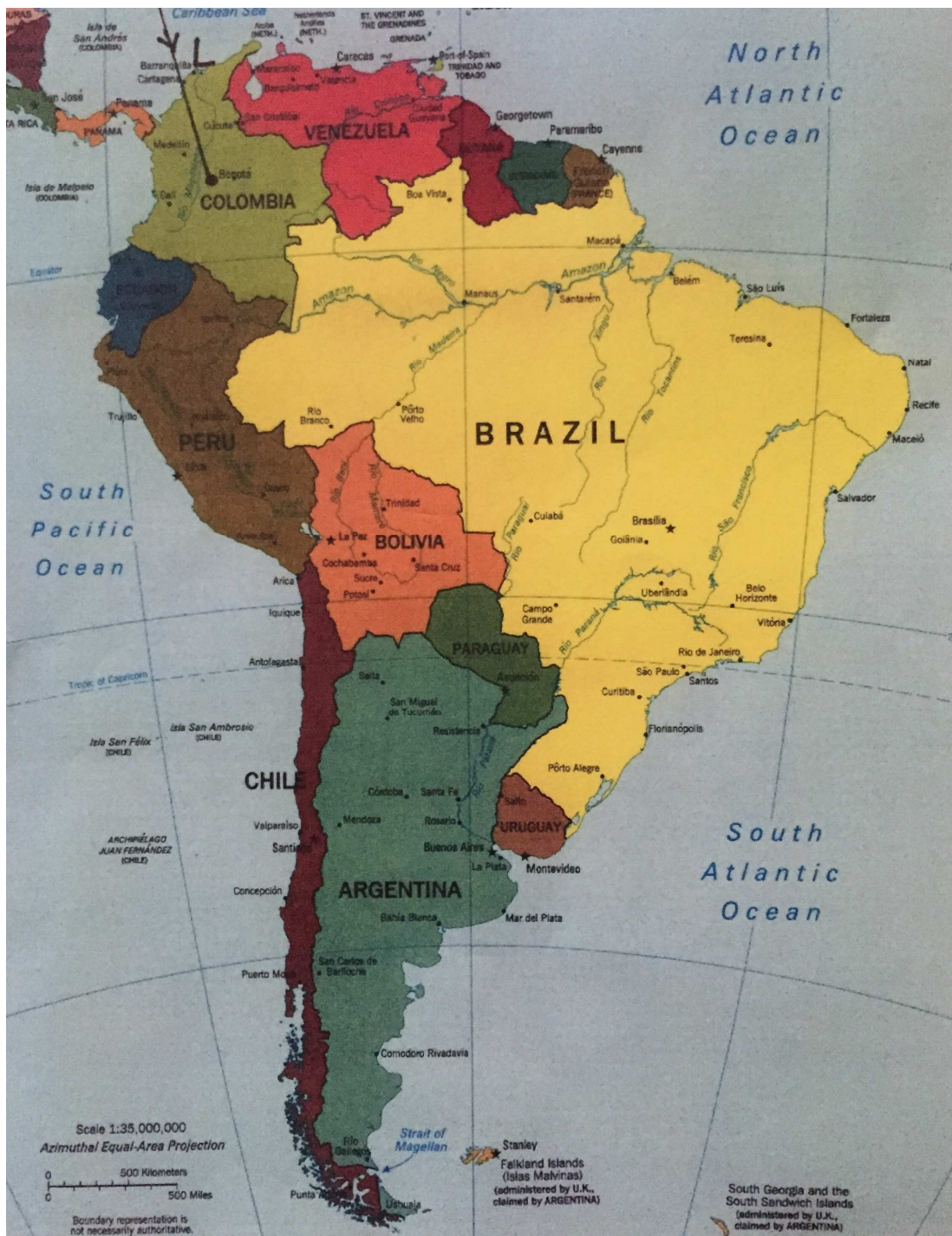
Obrázek č. 4- Mapa přeletů po Jižní Americe. Upraveno podle [40]