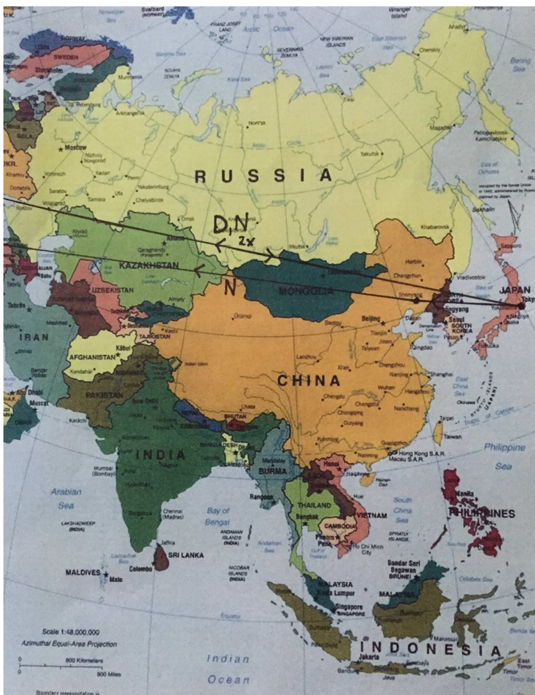
Obrázek č. 5- Mapa přeletů po Asii. Upraveno podle [41]