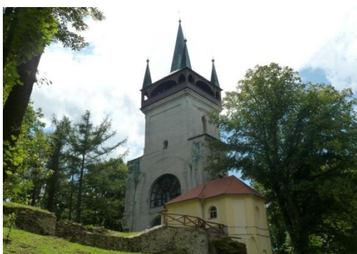
Obr. č. 5 Rozhledna Bolfánek

Již z daleka je viditelná rozhledna Bolfánek nad Chudenicemi a vytváří tak jakousi dominantu této krajiny. Po výstupu na vrchol rozhledny se naskytne dokonalý kruhový výhled na panorama Šumavy, vrcholy Českého lesa. Je možno spatřit i Radyni, Plzeň, Brdy a při dobré viditelnosti i Krušné hory a vrcholky Alp. Rozhledna je původní věž kostela sv. Wolfganga, který stával na kopci Žďár od dávných dob. Byla zřízena již roku 1845. Posléze dostavěna do výšky 45m a proměněna z původní do dnešní podoby. Kámen v tzv. Šlápějové kapli, stojící v těsné blízkosti Bolfánku, vypovídá, že se jedná o staré, pravděpodobně keltské kultovní místo. Ke vzniku kostela se váže několik pověstí. Jednou z nich je pověst, že Wolfgang (biskup v bavorském Řezně) šel pěšky z Řezna do Prahy vysvětit prvního pražského biskupa a při zpáteční cestě se zastavil na návrší u Chudenic, kde přenocoval a založil kostel. (Zdroj: Muzeum Starý zámek Chudenice, pověsti). Kostel byl dekretem císaře Josefa II. roku 1786 označen jako filiální a po roce 1810 zbořen až na věž. Tím zcela zanikla tradice tohoto křesťanského poutního místa.