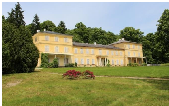
Obr. č. 7 Zámek Lázeň

Zdroj: (obr. č. 6) Občanské sdružení Otisk, dostupné z http://www.otisk.org/americka-zahrada