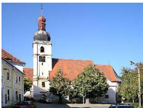
Obr. č. 2 Kostel sv. Jana Křtitele

Druhou nejzajímavější památkou v Chudenicích je Starý zámek, kolébka rodu Czerninů z Chudenic. Její dosud poznané základy pocházejí přibližně z poloviny 14. století, ale stejně jako u kostela, lze i v případě této pamětihodnosti předpokládat, že na jejím místě stávalo panské sídlo mnohem starší. Ve stavební historii Starého zámku se promítají tři důležité mezníky. První zásadní úpravu prodělala stará gotická tvrz po husitských válkách, kdy byly využity nové poznatky o palných zbraních, a celý areál byl doplněn baštami, které doplnily její fortifikaci. Velmi zásadní proměnou prošlo staré nepohodlné feudální sídlo na konci 16. století za Humprechta Czernina z Chudenic, kdy byla tvrz přestavěna na pohodlnější renesanční zámeček. Z této doby pochází nejen sgrafitové fasády na části objektu, ale také půvabný Andělský pokoj a Černá kuchyně. Dnešní podobu zámku vtiskla až pozdně barokní přestavba za Prokopa Czernina z Chudenic, která proběhla roku 1776 pod vedením architekta Karla Ballinga. Zámek je v majetku městyse Chudenice, je veřejnosti přístupný a od roku 2000 prochází náročnou adaptací. Návštěvníci si mohou v interiérech prohlédnout regionální muzejní expozici, czerninskou zámeckou expozici vybavenou původním nábytkem ze zámku Lázeň u Chudenic, rodnou síň básníka a spisovatele Jaroslava Kvapila, expozici Josefa Dobrovského a farnosti Chudenice.