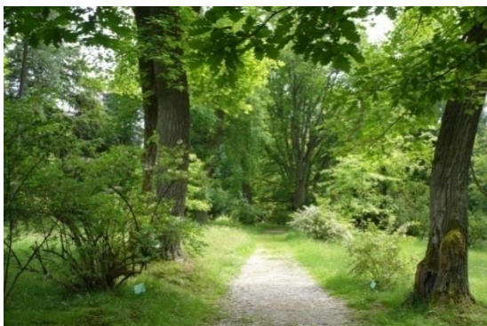
Obr. č. 6 Americká zahrada

Pod Bolfánkem, na jižním úpatí vrchu Žďár, stojí empírový zámek Lázeň. Ten nechal do dnešní podoby upravit po roce 1864 majitel panství hrabě Eugen I. Czernin z Chudenic jako letní sídlo své rodiny. Původně sloužil jako lázeňský dům a to díky léčivému pramenu na úpatí vrchu Žďár. Také se zde prvně setkáváme s označením tzv. „Badhaus“, nebo-li lázeňský dům (1786). Zámek obklopuje anglický krajinářský park, který je veřejnosti volně přístupný stejně jako nedaleké arboretum a národní přírodní památka Americká zahrada, založená Czerniny v roce 1842. Nalezneme zde jednu z nejstarších jedlí douglasových na evropském kontinentu či evropský unikát, dřín květnatý. Vlastníkem této Americké zahrady je stát, hospodaří zde Lesy ČR s. p. a správu nad tímto chráněným územím vykonává AOPK ČR - Správa CHKO Český les. Soubor dřevin je pravidelně doplňován novými druhy dle platného plánu péče.