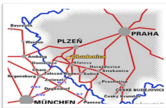
Obr. č. 1 Mapa lokace městysu Chudenice

Do správního obvodu Chudenic spadají obce Slatina, Lučice, Bezpravovice a Býšov a osady Bělýšov a Vyšensko. Celková rozloha katastrálního území je 2 113 ha. Ke dni 31. 10.2013 měly Chudenice se spádovými obcemi celkem 728 obyvatel.