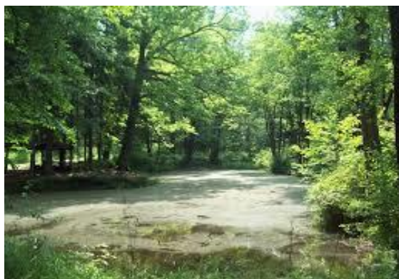
Obr. č. 8 Kvapilovo jezírko