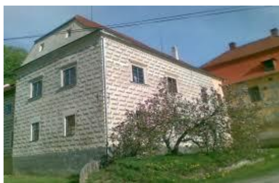
Obr. č. 3 Starý zámek

Zdroj (obr. č. 2): http://www.farnostsvihov.estranky.cz