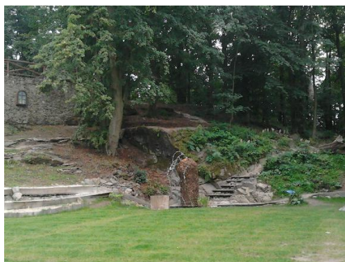
Obr. č. 10 přírodní divadelní scéna Rusalčina jezírka