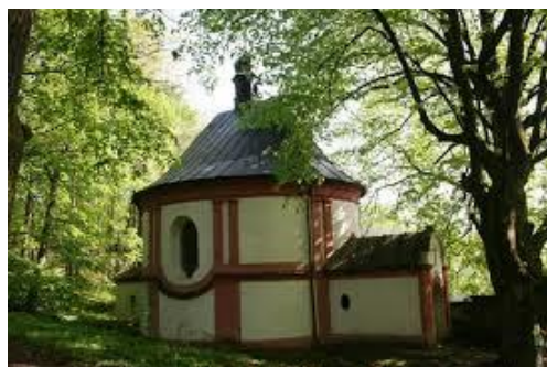
Obr. č. 4 Kaple sv. Anny