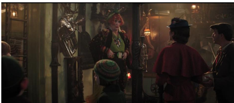
Obrázek 8 „Turning Turtle“ – Příklad 18a/18b

Vpřed je vzad, ticho hluk, tenký tlustým, co by dup, pásek proto povolit si musím.