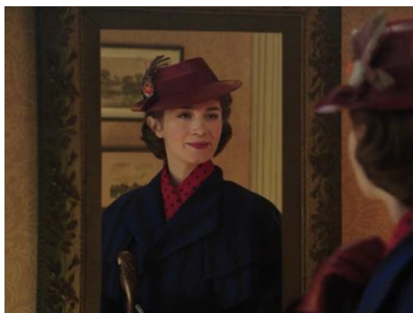
Obrázek 3b Zrcadlo a Mary Poppins (2018)

Nechybí ani velké taneční číslo lampářů či dnes již klasická animovaná scéna: