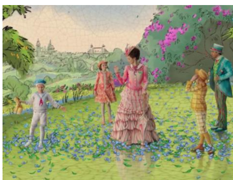
Obrázek 4b Animovaná scéna (2018)

Aluze na původní film najdeme ale i v hudebním podkladu. Ve chvíli, kdy se Mary Poppins vrátí do Třešňové ulice, uslyší divák hlavní motiv z písně „Spoonful of Sugar“, v české verzi „Lžička cukru“. V písni „Nowhere to Go But Up“, ve chvíli, kdy Michael chytí balónek, lze zaslechnout hlavní motiv ze závěrečné písně filmu z roku 1964 „Let’s Go Fly a Kite“. V závěrečné scéně, když si Michael s Jane uvědomí, že Mary Poppins opět odešla, pro změnu uslyšíme dva takty písně „The Perfect Nanny“, ve které mladý Michael s Jane čtou svým rodičům požadavky na prakticky perfektní chůvu.