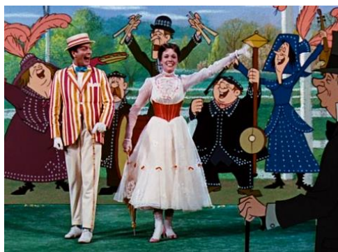
Obrázek 3a Animovaná scéna (1964)

Nechybí ani velké taneční číslo lampářů či dnes již klasická animovaná scéna: