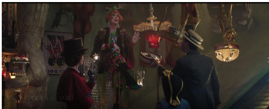
Obrázek 9 „Turning Turtle“ – Příklad 19