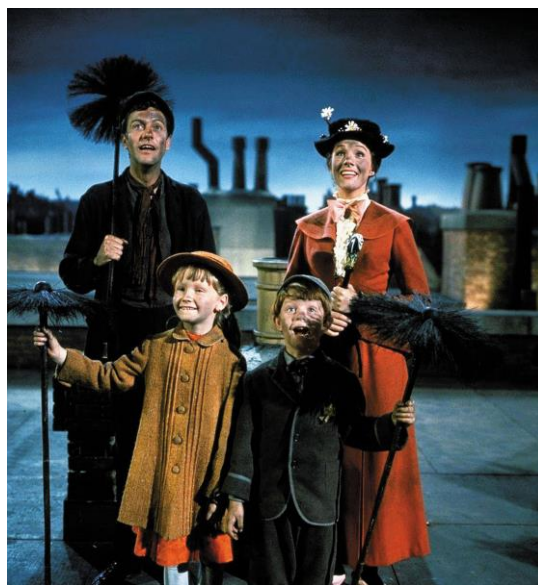
Obrázek 1 Původní obsazení filmu Mary Poppins (1964)

Další den se změní vítr. Pan Banks mezitím dětem opraví draka a společně s nimi ho jdou pouštět do větru („Let’s Go Fly a Kite“). V parku potkají syna ředitele banky, který jim sdělí, že jeho otec zemřel smíchem. Dawesonův syn je panu Banksovi natolik vděčný, že jeho otec zemřel šťastný, že ho přijme zpět do práce, a dokonce ho povýší. Mary Poppins odlétá se západním větrem pryč.