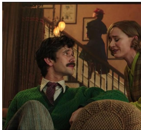
Obrázek 2b Příchod Mary Poppins (2018)