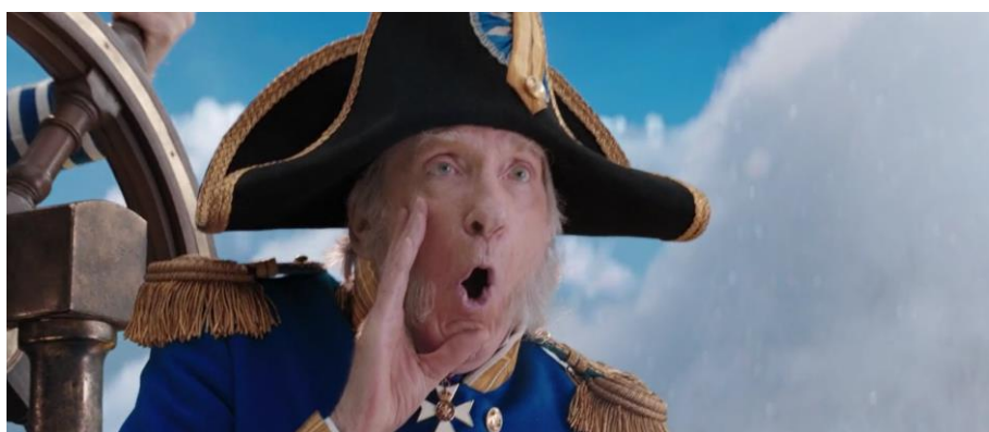
Obrázek 10 „Can You Imagine That“ – Příklad 20