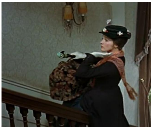
Obrázek 2a Příchod Mary Poppins (1964)

Filmový muzikál Mary Poppins se vrací promyšleně kopíruje původní strukturu filmu Mary Poppins (1964). Začíná úvodními titulky podkreslenými hudbou z filmu. Úvodní píseň patří hlavní mužské postavě (v původním filmu Bertovi, v pokračování Jackovi). Poté nastává příchod chůvy, který kopíruje prvotní příchod Mary Poppins k rodině Banksových do nejmenších detailů, včetně jejího požadavku, že chce každé druhé úterý volno. Než se stihne kdokoliv ohradit, už jede po zábradlí nahoru do prvního patra.