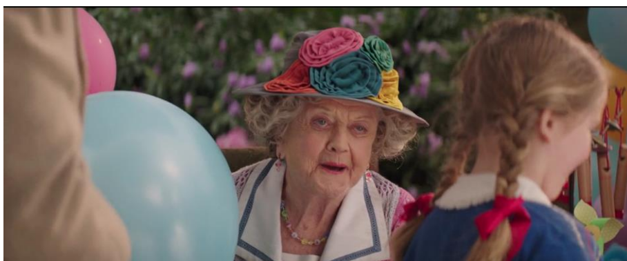
Obrázek 11 „Nowhere to Go But Up“ – Příklad 21

Překladatel musel omezení synchronizace rtů zohlednit i v písni „Nowhere to Go But Up“. Píseň je v tříčtvrtěčném tempu a herečka Angela Lansburyová napůl zpívá a napůl hovoří; má tudíž poměrně výraznou dikci. Vě větě „ Choose the secret we know before life makes us grow , there's nowhere to go but up “, jsou důležitá zejména zvýrazněná slova. Ve slově choose je výrazná výslovnost hlásky /u/, ve slově know dvojhhláska /ou/, stejně jako ve slově grow a go . Slovo up je krátké, důrazné a doprovázené výrazným gestem. Cmíral všechny tyto prvky zachovává: „Úžas v očích si čtou , ti co dál dětmi jsou , žij pohádku svou a leť! “