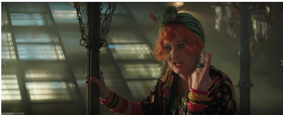
Obrázek 6 „Turning Turtle“ – Příklad 16

Podobný příklad najdeme i v písni „Turning Turtle“. V příkladu (16) na slovo second ukazuje Topsy také prsty číslo dvě, takže je znovu nutné v textu tuto informaci nějakým způsobem zachovat. Cmíral opět koherenci úspěšně zachovává výrazem „strašná druhá středa“.