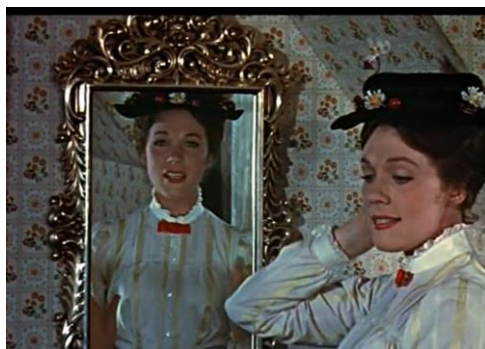
Obrázek 3a Zrcadlo a Mary Poppins (1964)

Podobných odkazů na původní film najdeme v Mary Poppins se vrací mnoho. Typická je např. scéna s magickým zrcadlem.