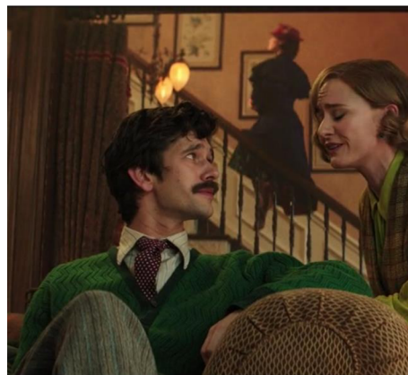
Obrázek 2b Příchod Mary Poppins (2018)