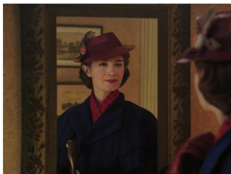
Obrázek 3b Zrcadlo a Mary Poppins (2018)

Nechybí ani velké taneční číslo lampářů či dnes již klasická animovaná scéna: