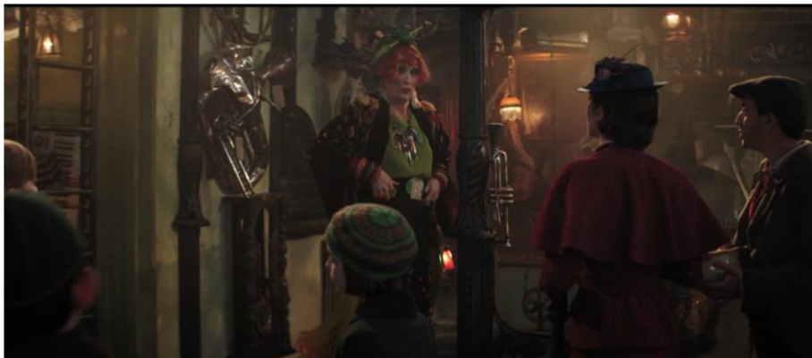
Obrázek 8 „Turning Turtle“ – Příklad 18a/18b

Vpřed je vzad, ticho hluk, tenký tlustým, co by dup, pásek proto povolit si musím.