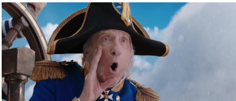
Obrázek 10 „Can You Imagine That“ – Příklad 20

Dalším omezením, které musí překladatel při překladu zohlednit, je synchronizace rtů. Na toto omezení Cmíral narazil při překladu písní ve filmovém muzikálu Mary Poppins se vrací mnohokrát. Konkrétně v příkladu (20) v písni „Can You Imagine That“ se jedná např. o pasáž, ve které se děti s chůvou plaví na lodi a John přepadne přes palubu. Admirál křičí: „Man overboard!“ Za normálních okolností by mohlo být vhodným řešením „muž přes palubu“, jenže v tomto případě kamera zblízka zabírá hercův obličej a české spojení „muž přes palubu“ má o jednu slabiku navíc oproti anglickému „man overboard“. Cmíral proto volí řešení „muž ve vlnách“, které sice není ideální, ale rozhodně je tou lepší variantou. Výslovnost samohlásky „o“ je totiž poměrně podobná samohlásce „a“ a umožňuje ji podržet déle, než krátké „u“ ve větě „muž přes palubu“.