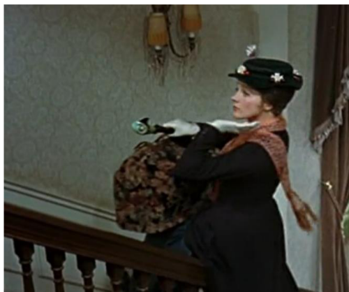
Obrázek 2a Příchod Mary Poppins (1964)

Filmový muzikál Mary Poppins se vrací promyšleně kopíruje původní strukturu filmu Mary Poppins (1964). Začíná úvodními titulky podkreslenými hudbou z filmu. Úvodní píseň patří hlavní mužské postavě (v původním filmu Bertovi, v pokračování Jackovi). Poté nastává příchod chůvy, který kopíruje prvotní příchod Mary Poppins k rodině Banksových do nejmenších detailů, včetně jejího požadavku, že chce každé druhé úterý volno. Než se stihne kdokoliv ohradit, už jede po zábradlí nahoru do prvního patra.