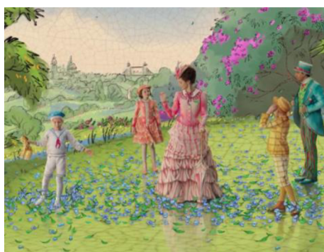
Obrázek 4b Animovaná scéna (2018)

Aluze na původní film najdeme ale i v hudebním podkladu. Ve chvíli, kdy se Mary Poppins vrátí do Třešňové ulice, uslyší divák hlavní motiv z písně „Spoonful of Sugar“, v české verzi „Lžička cukru“. V písni „Nowhere to Go But Up“, ve chvíli, kdy Michael chytí balónek, lze zaslechnout hlavní motiv ze závěrečné písně filmu z roku 1964 „Let’s Go Fly a Kite“. V závěrečné scéně, když si Michael s Jane uvědomí, že Mary Poppins opět odešla, pro změnu uslyšíme dva takty písně „The Perfect Nanny“, ve které mladý Michael s Jane čtou svým rodičům požadavky na prakticky perfektní chůvu.