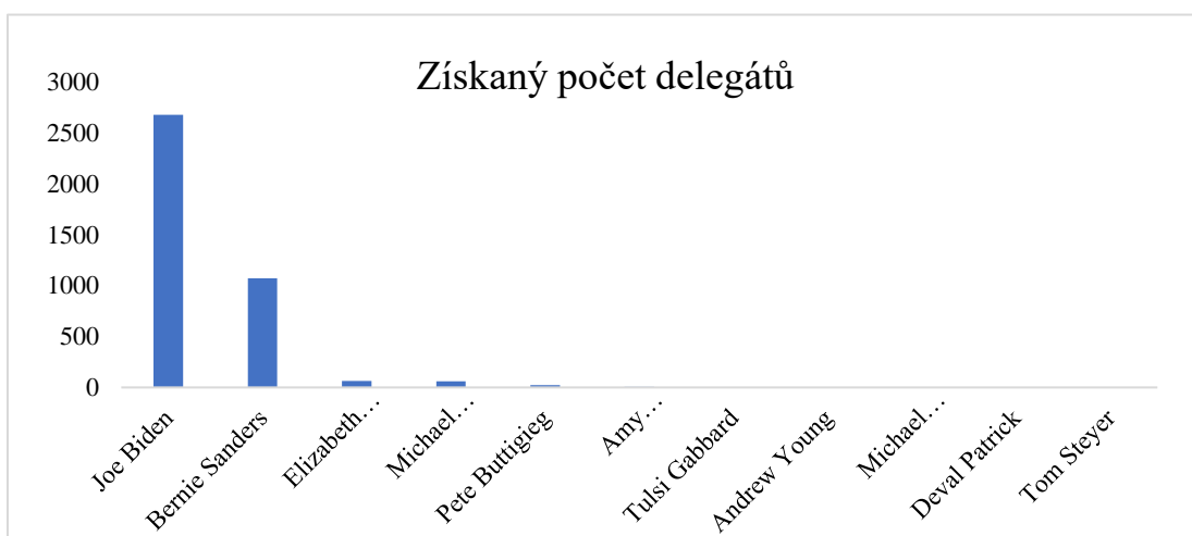
Graf č. 1 – Počet získaných delegátů v rámci demokratických primárek 2020