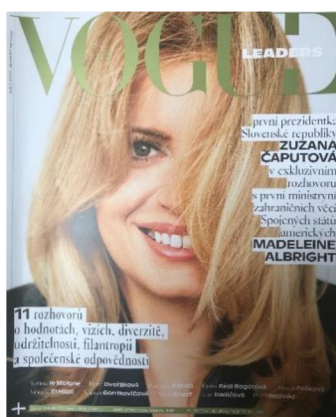
Obrázek 14: Obálka první přílohy Vogue Leaders CS.