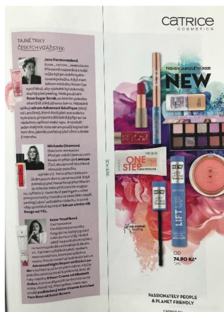
Obrázek 16: Reklama na Cruelty Free kosmetiku vedle článku s kosmetikou testovanou na zvířatech v Marianne červenec 2021.

Při zkoumání obrazových inzercí jsme rovněž pohlíželi na jejich umístění v magazínu. Zatímco ve Vogue CS byla inzerce Cruelty Free kosmetiky umístěna vedle tipů na e-shopy s oblečením, v Marianne byla umístěna reklama na Cruelty Free kosmetiku Catrice vedle článku s tipy vizážistek na kosmetické produkty testované na zvířatech. I přesto, že se jednalo o různé typy kosmetiky 38 , umístění produktů testovaných na zvířatech hned vedle reklamy na produkty netestované na zvířatech není ideální (viz obrázek 16).