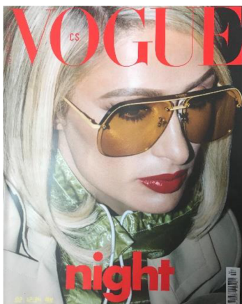
Obrázek 13: Jedna z červencových/srpnových obálek časopisu Vogue CS.