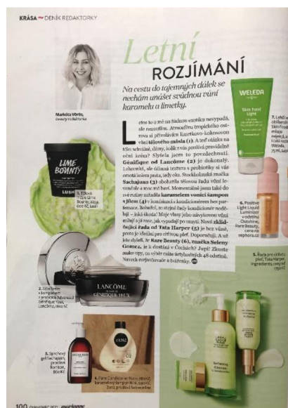
Obrázek 15: Rubrika Deník redaktorky v červencovém vydání Marianne.