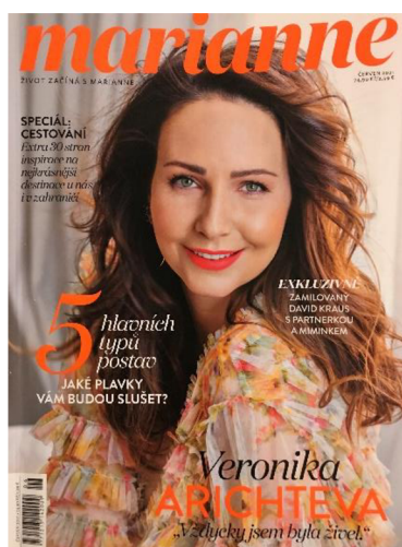
Obrázek 7: Červnová obálka časopisu Marianne.