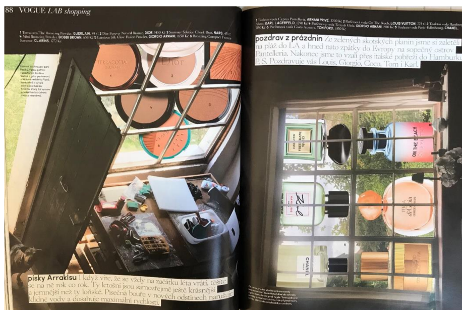
Obrázek 17: Estetické zpracování kosmetických produktů v červnovém vydání magazínu Vogue CS 2021.

Z poznatků získaných při zkoumání vybraných magazínů vyplývá, že Vogue CS klade při zpracovávání jednotlivých stran větší důraz na estetičnost než Marianne, které má všechny stránky vizuálně podobné. Ani jeden z magazínů však není úspěšný při výběru vyváženého množství Cruelty Free produktů a kosmetiky testované na zvířatech do obsahu. Nelze tedy tvrdit, že by redakce obou magazínů kladly větší důraz na přístup výrobců zobrazované kosmetiky k problematice Cruelty Free před estetickou stránkou.