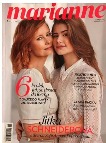
Obrázek 6: Květnová obálka časopisu Marianne.