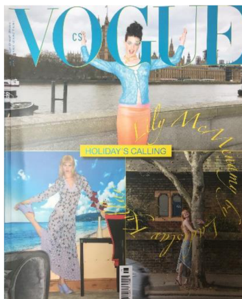
Obrázek 12: Jedna z červnových obálek časopisu Vogue CS.