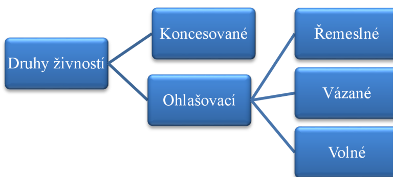
Obrázek 2: Druhy živností (vlastní zpracování dle 3, s. 67; 4)

ŽZ v § 9 dělí živnosti na koncesované a ohlašovací , které mohou vykonávat jak osoby fyzické, tak právnické za předpokladu splnění podmínek tímto zákonem (4, §§ 8-9). Na základě úrovně odbornosti, případně jejího způsobu doložení dělíme živnosti ohlašovací na řemeslné , vázané a volné . Aby mohla osoba vykonávat ohlašovací živnost, musí splňovat tři základní podmínky vymezené v § 6 ŽZ (4, § 6). V případě provozování jiné odborné činnosti, je zapotřebí splňovat zvláštní podmínky, pokud je tento zákon nebo zvláštní předpisy vyžadují. Naopak u koncesovaných živností se klade větší důraz na jejich odbornou způsobilost, a proto vzniká dle § 10 až v den rozhodnutí právní moci o udělení koncese (4; 35, s. 49-67).