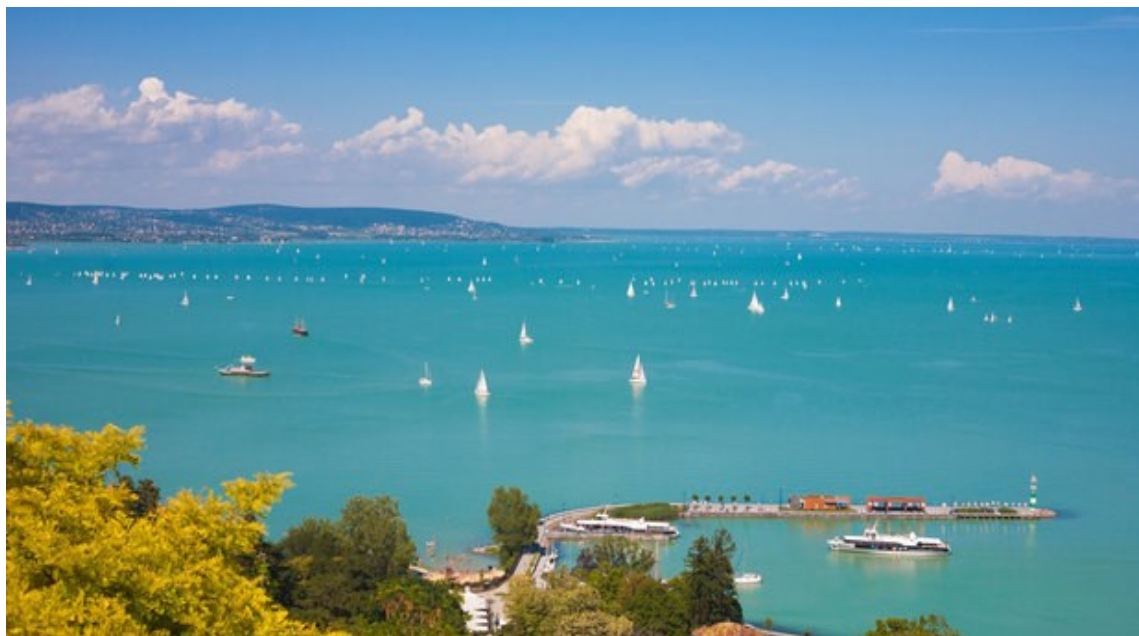
Obr.1.5 Jezero Balaton

Velmi oblíbené jsou celodenní výlety na Balaton, kde si mohou turisté vypůjčit vodní lyže a využívat další různé atrakce nebo koupání. [WellnessTips, 2018]