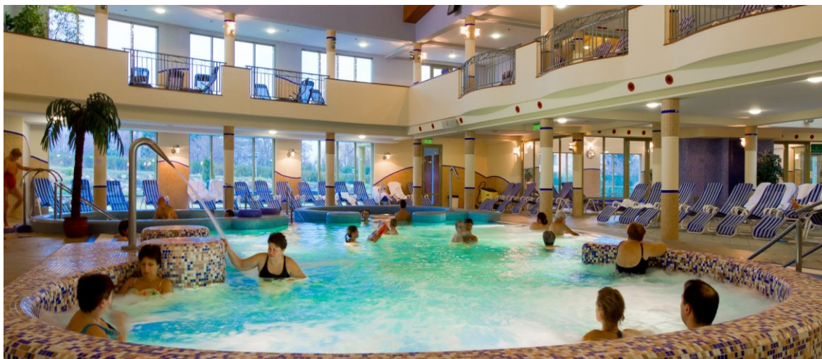
Obr. 1.4 Lázně Zalakaros

Mezi nejzajímavější místa v tomto okolí je například ptačí rezervace v Zimány nebo také blízké město Zalavár, které je proslulé svými zříceninami staroslovanského hradiště. [WellnessTour, 2018]