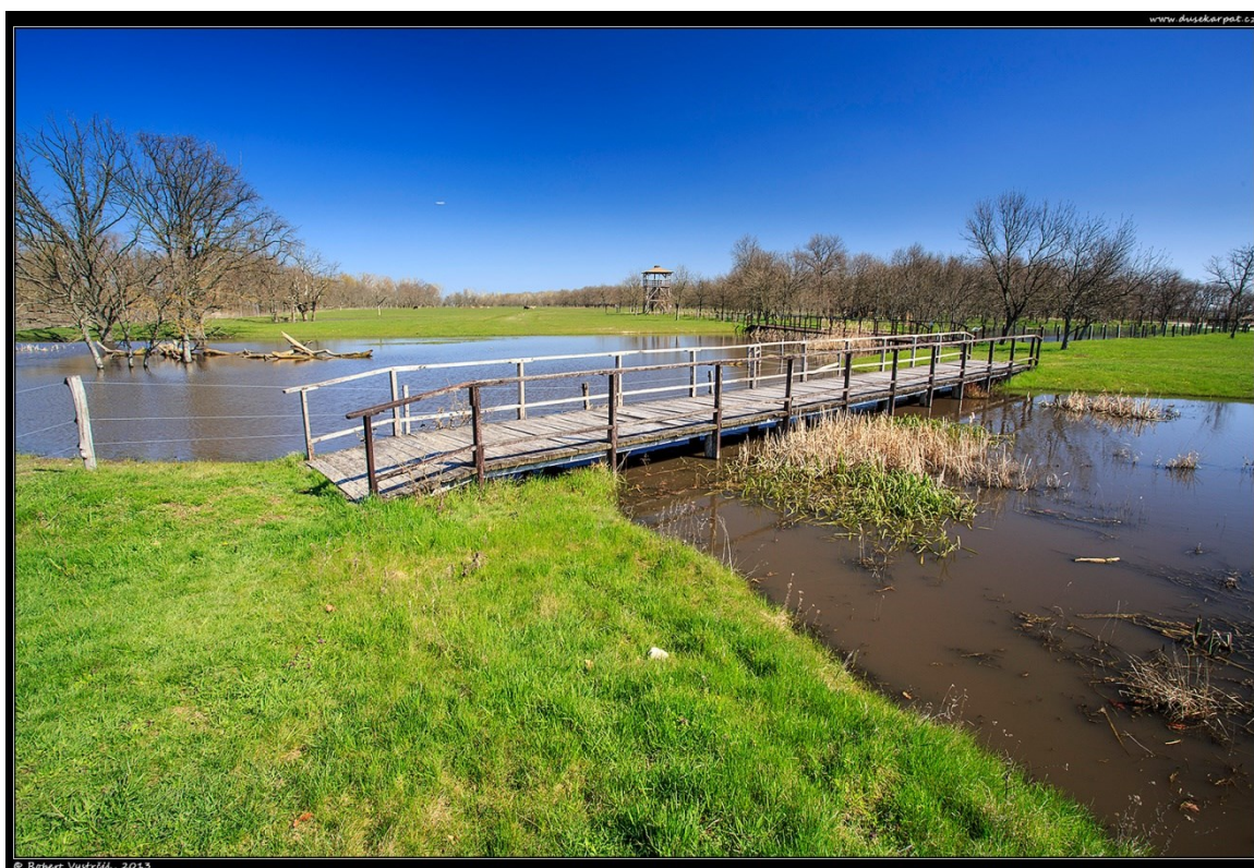
Obr. 1.1 Národní park Hortobágy

Maďarsko má neobyčejně vysoké know – how, které se týče lázeňství, zdraví, a prevence. Nejmodernější diagnostika, široká nabídka programů, procedur a léčivá voda dělá z Maďarska jedno z nejlepších míst pro zdraví turistů. [BusssinessInfo/Maďarsko, 2018]