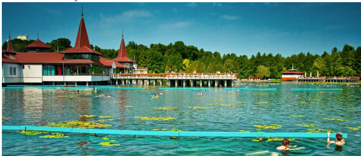
Obr. 1.2 Termální jezero Héviz