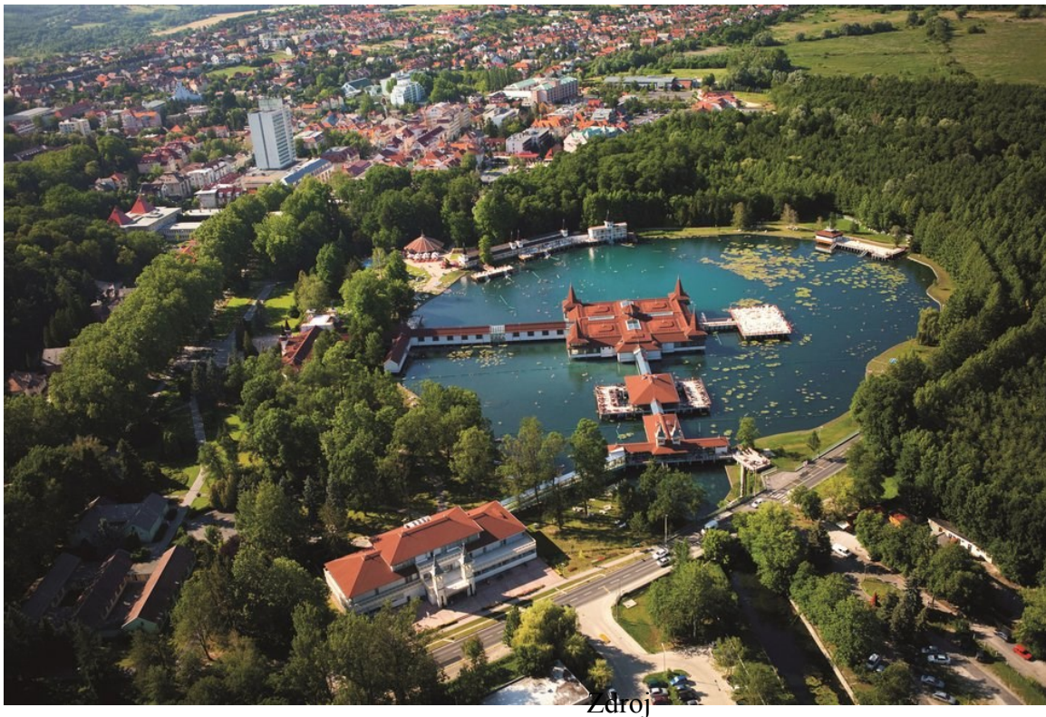
Obr. 1.3 Lázeňské město Héviz