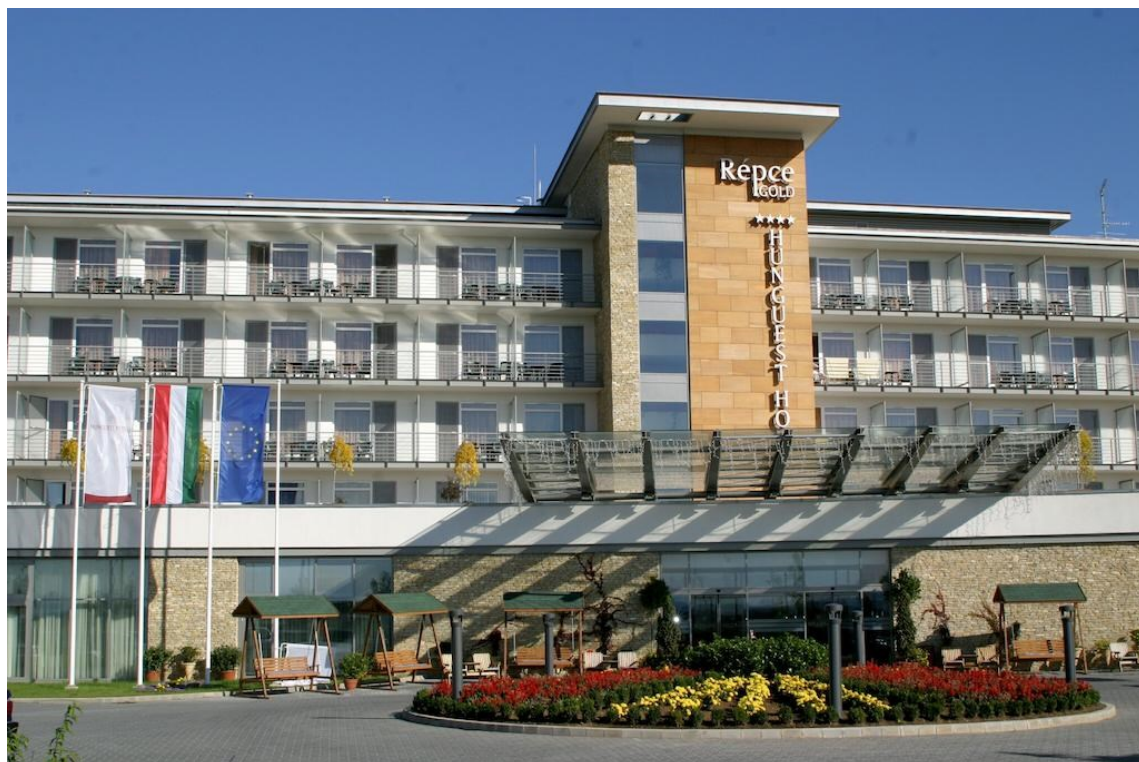
Obr. 4.4 Hotel Répce Gold