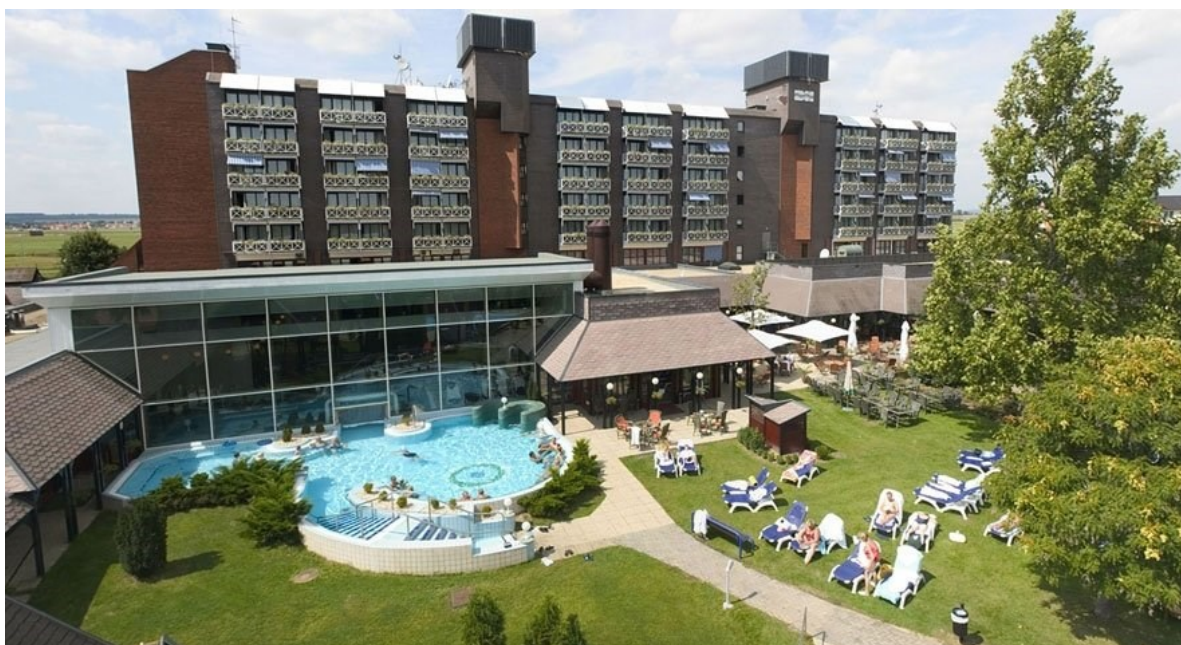
Obr. 4.5 Danubius Hotel Spa Resort