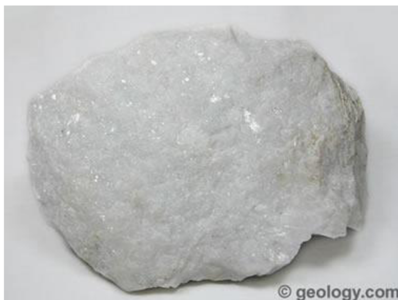
Obrázek č.7: Baryt- minerál (Geology, 2022)

V recyklačním procesu je baryt sotva kdy znovu používán. Důvod nerecyklování barytu je takový, že baryt tvoří zanedbatelné náklady při jakémkoliv vrtném projektu. Jeho těžba je tedy závislá přímo na světových nově otevíraných vrtných ložiscích ropy. Výjimku při recyklaci tvoří jeho použití ve skle při recyklaci skla (Bleiwas et al. 2015).