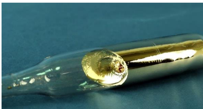
Obrázek č.10: Cesium, ( Chemistry learner, 2022)

Po dokončení vrtu, se použitá solanka mravenčanu cesného vrací a znovu zpracovává pro další vrtné práce. Mravenčanové solanky se recyklují s odhadovanou mírou výtěžnosti 85 %, které lze znovu zpracovat pro další použití (Tuck 2021).