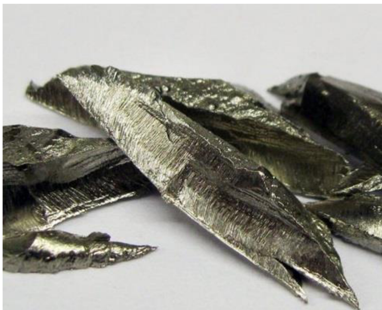
Obrázek č.6: Nikl-kov, ( Lpdental, 2022)

Po následné redukci se zpracovávaná surovina louží v amoniakálním roztoku uhličitanu amonného. Celý vzniklý nikelnatý komplex se rozkládá vodní parou na zásaditý uhličitan nikelnatý, ze kterého se po rozpuštění v kyselině sírové získá čistý kovový nikl. Odpadní kaly vzniklé při elektrolytické rafinaci niklu jsou nedílným zdrojem kobaltu, iridia, rutheria a dalších prvků (Greenwood et al. 1997).