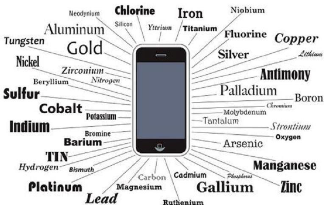
Obrázek č.2: Prvky používané v moderních chytrých telefonech (Sputtertargets,2022)

Hospodářství a průmysl Evropské unie jsou závislé na mezinárodních trzích, které jsou schopny poskytnout přístup k mnoha surovinám ze zemí EU. Ačkoliv v Evropské unii existuje i domácí výroba, ve většině případů je Evropská unie závislá na dovozu. Například Čína poskytuje Evropské unii 98 % vzácných zemin, z Turecka je do Evropské unie dováženo 98 % dodávek boritanu. Jižní Afrika zajišťuje pro Evropskou unii 71 % potřeb platinových kovů. Riziko spojené s koncentrací výroby je v mnoha případech umocněno nízkou mírou substituce a recyklace. Evropská unie proto vytvořila seznam kritických surovin, který podléhá pravidelnému přezkumu a aktualizacím. První seznam vytvořila Evropská komise v roce 2011 jako „iniciativu EU v oblasti surovin“. První seznam obsahoval 14 surovin, které jsou pro Evropskou unii a její hospodářství klíčové. Seznamy podléhají přezkoumání každé 3 roky a stále se rozšiřují. Čtvrtý seznam z roku 2020 obsahuje 30 materiálů (antimon, hafnium, fosfor, baryt, těžké vzácné prvky, skandium, beryllium, lehké vzácné prvky, silikonový kov, vizmut, indium, tantal, boráty, hořčík, wolfram, kobalt, přírodní grafit, vanadium, koksovateľné uhlí, přírodní guma, bauxit, fluorspar, niob, lithium, galium, platinové kovy, titan, germanium, stroncium a fosfáty), ve srovnání se 14 surovinami z roku 2011, 20 surovinami z roku 2014 a 27 surovinami z roku 2017. Seznamy by měly pomoci zvýšit konkurenceschopnost evropského průmyslu, stimulovat výrobu