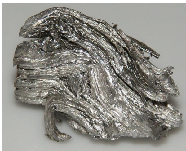
Obrázek č.9: Rubidium, ( Chemistry learner, 2022)

Průmyslová výroba rubidia je prováděna elektrolýzou roztavené směsi chloridu vápenatého a chloridu rubidného při teplotě 750^\circ\text{C} . Při elektrolýze dochází k tuhnutí vápníku, jeho teplota tání je vyšší než rubidia a tím dochází k jeho oddělování. Elektrolýza probíhá na železné katodě a grafitové anodě. Druhou průmyslovou možností výroby rubidia, která je pro výrobu kovu vhodnější je příprava chemickou cestou. Chemicky se rubidium připravuje zahříváním hydroxidu rubidného nebo oxidu rubidného s kovovým hořčíkem v proudu vodíku nebo s kovovým vápníkem ve vakuu. Jako nejlepší redukční činidlo je považováno zirkonium (Greenwood et al. 1997).