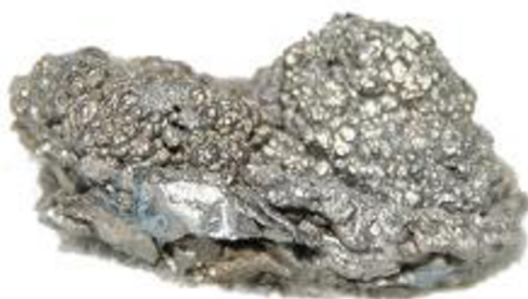
Obrázek č.5: Hafnium-kov, ( Prvky, 2017)

tepelná difúze, extrakce rozpouštědlem a elektrochemická separace (Latunussa et al. 2020).