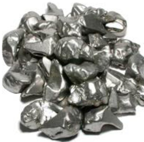
Obrázek č.8: Zirkonium-kov, ( Prvky, 2017)

kovů. Avšak pro využití v jaderné energetice je potřeba hafnium od zirkonia oddělit (Greenwood et al. 1997).