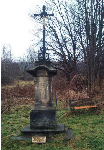
Obr. 3 - Kříž u Rozstání