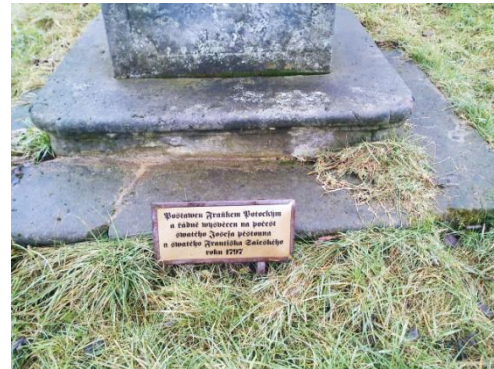
Obr. 4 - Kříž u Rozstání - detail

Ráz ještědských románů však také určovaly nároky doby. Důležité byly požadavky objednatele, představa adresáta, ale také odezva čtenáře (Janáčková, 1985, str. 117). „ Počínaje Křížem u potoka koncipovala Světlá své romány s ohledem na lidového čtenáře věduoc, že se tak omezuje, a nepřestávala pomýšlet na tvorbu nebrzděnou požadavky čtivosti. “ (Janáčková, 1985, str. 123)