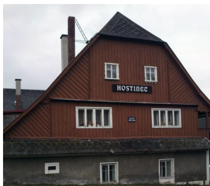
Obr. 2 – Fotografie hostince ve Světlé pod Ještědem – dějiště Vesnického románu

Realistický popis zasahuje také do idylické scény štědrého večera v chaloupce Jirovcové. Světlá se věnuje líčení vánočních tradic, zároveň zachycuje proměnu charakteru Antoše. Podle Liškové (1940) se jedná o „ucelenou povídku