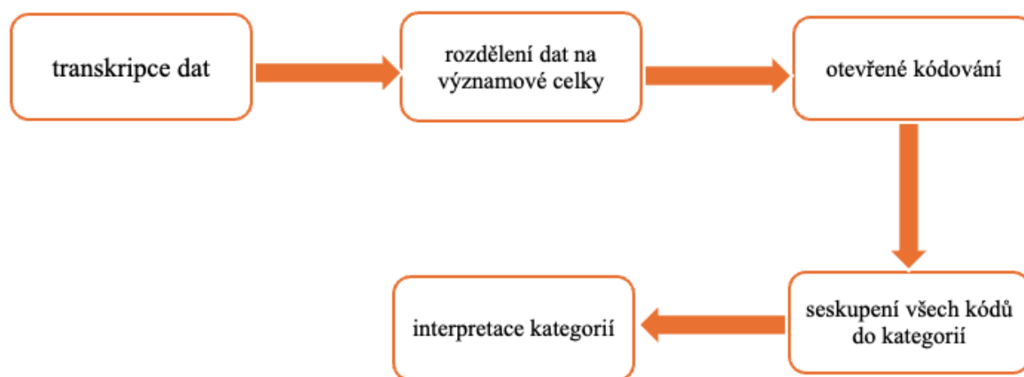
Obrázek 2: Schéma postupu přípravy, kódování a analýzy dat

Jako metodu záznamu jsem zvolila tzv. metodu papír a tužka. V rámci této metody jsem přiřazovala názvy kódů k datovému záznamu, což vedlo k rozložení celkového textu. Každému kódu bylo přiřazeno označení, které nejlépe charakterizovalo danou část. Po vytvoření kódů jsem přistoupila k procesu kategorizace, která spočívala v seskupování kódů na základě jejich podobnosti. V rámci tohoto procesu mi bylo nápomocné schéma, viz obrázek č. 2.