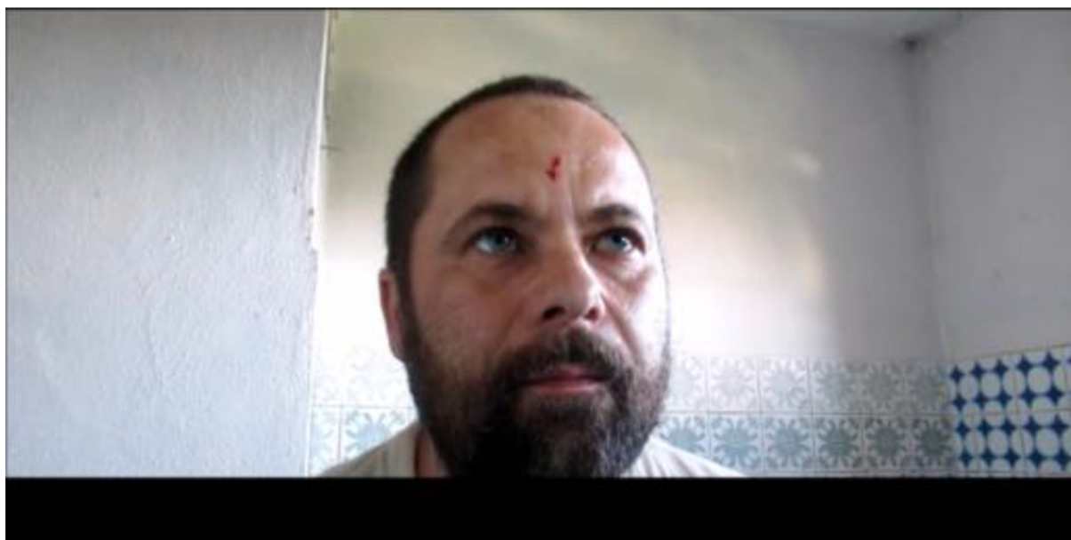
Návody - ošetření řezného poranění, digitální videozáznam 11:01 min., 2018