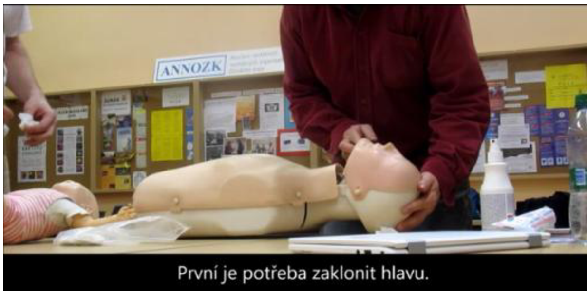
Návody - umělé dýchání, digitální videozáznam 11:01 min., 2018