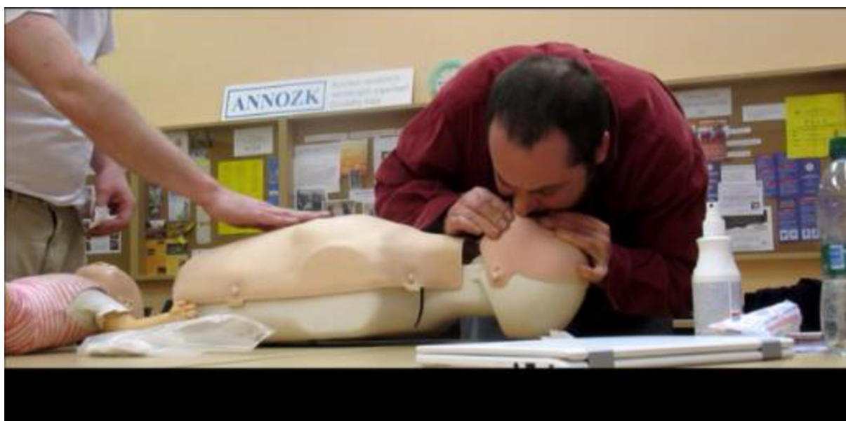
Návody - umělé dýchání, digitální videozáznam 11:01 min., 2018