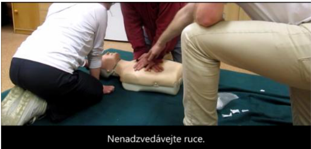
Návody - zevní srdeční masáž, digitální videozáznam 11:01 min., 2018