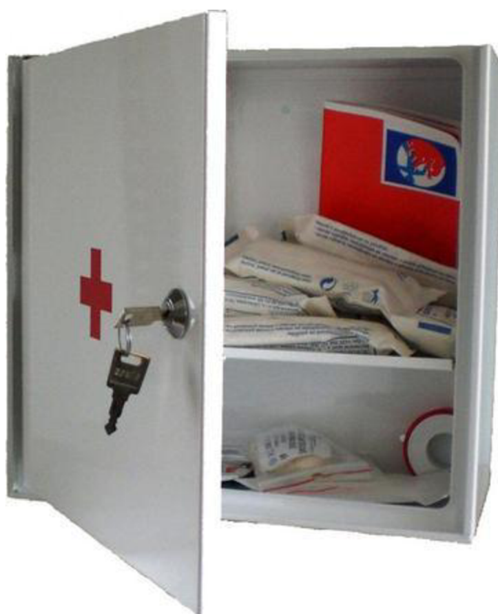
Lékárnička nástěnná kovová, 30 x 30 x 15 cm s vyměnitelnou náplní pro 10 osob, 2018

http://archiv.ffa.vutbr.cz/vskp/video/2018-kopcil-tomas-navody