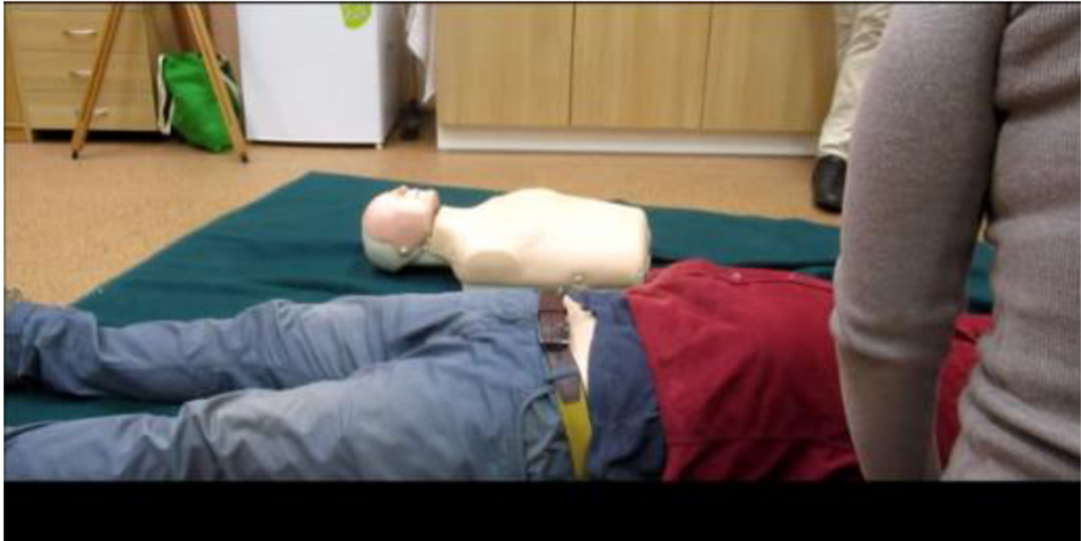
Návody - zevní srdeční masáž, digitální videozáznam 11:01 min., 2018