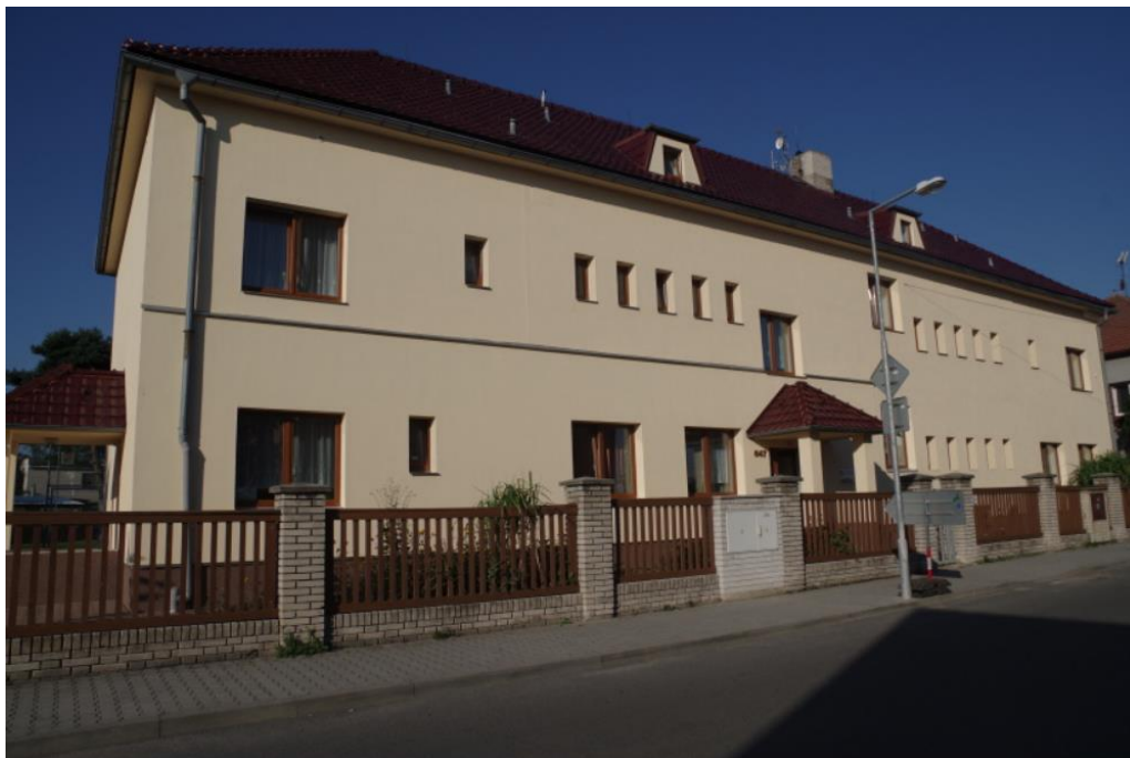
Obrázek 1: Fotografie DD, místo průzkumného šetření