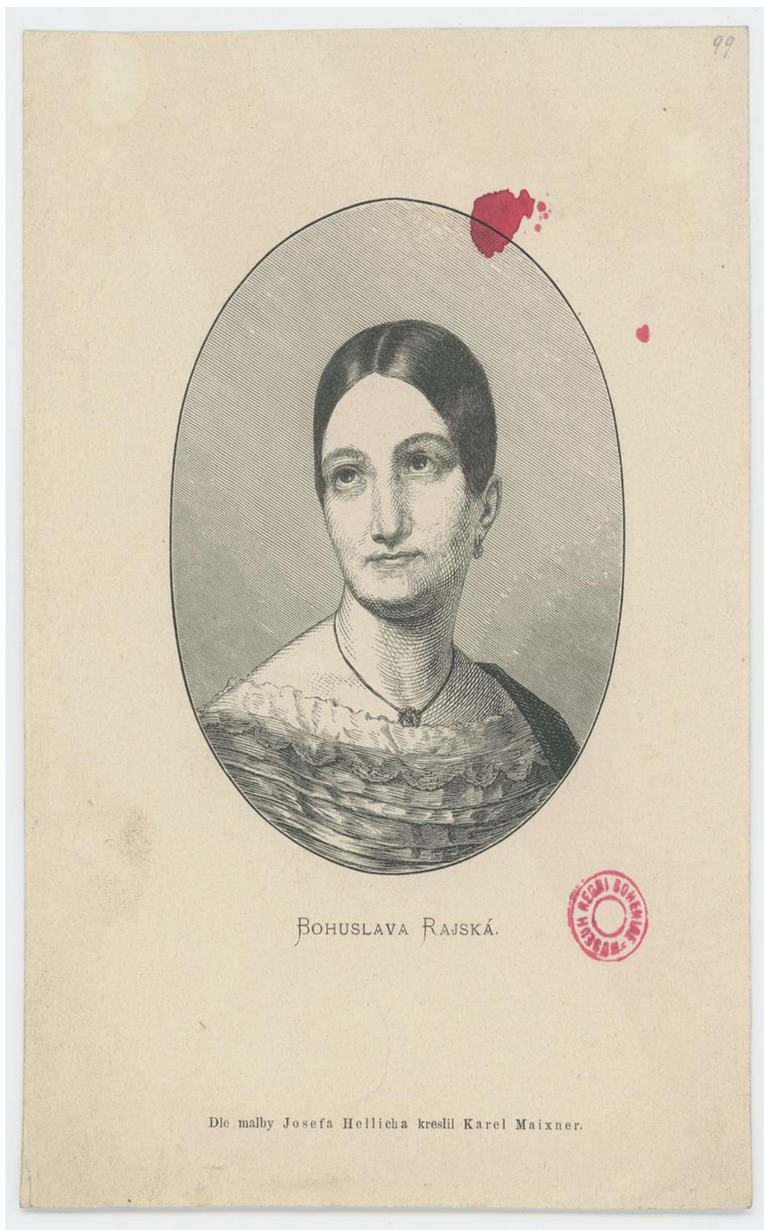
Příloha 3: (LA PNP- Fond Františka Ladislava Čelakovského, RAJSKÁ- ČELAKOVSKÁ Antonie tisky a výstřižky; pořadové číslo 535)