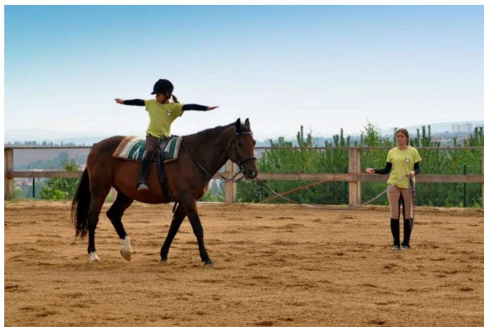
Obrázek 2: Instruktor jezdeckví a jezdec při výcviku na lonži.