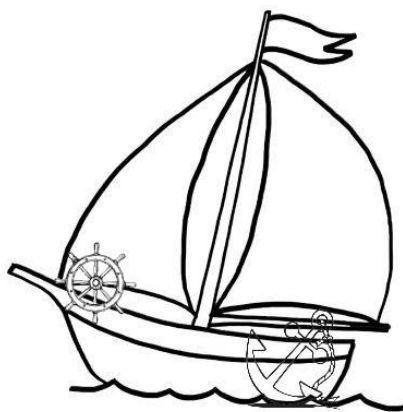
Obrázek 3 – návrh lodi.

Obě posádky se sejdou v klubovně. Protože jednotlivé části lodě byly v rámci aktivit rozděleny vítězům, ani jedna posádka nemůže postavit svoji vlastní loď. Proto musí dojít k závěru, že se z ostrova dostanou jen se vzájemnou pomocí. Společně pak sestaví loď – slepí/přivážou, všechny části lodě, (mohou si tam připevnit i své vlajky), tam kde mají být. Viz obrázek 3.