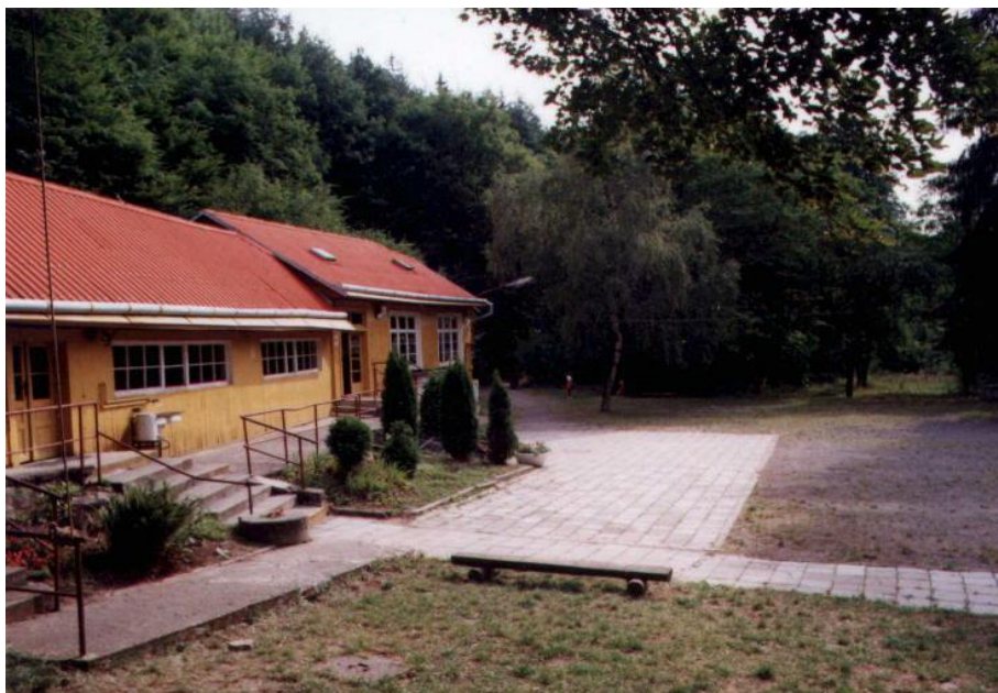
Obrázek 2 – Rekreační středisko Okluky.