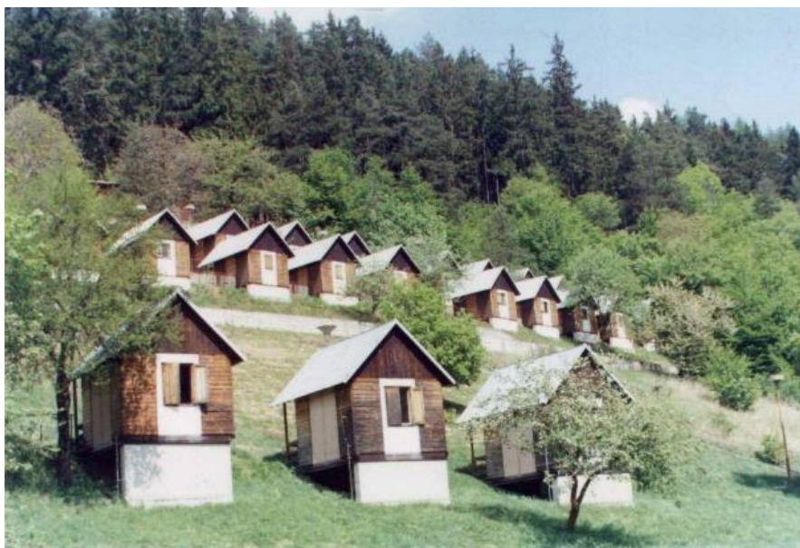
Obrázek 1 – Chaty v rekreačním středisku Okluky.

Zdroj: MOUČKA, K., 2003a. Rekreační středisko Okluky [online]. 2018 [cit. 4.4.2018]. Dostupné z URL: < http://www.okluky.cz/obrazky2.htm >.