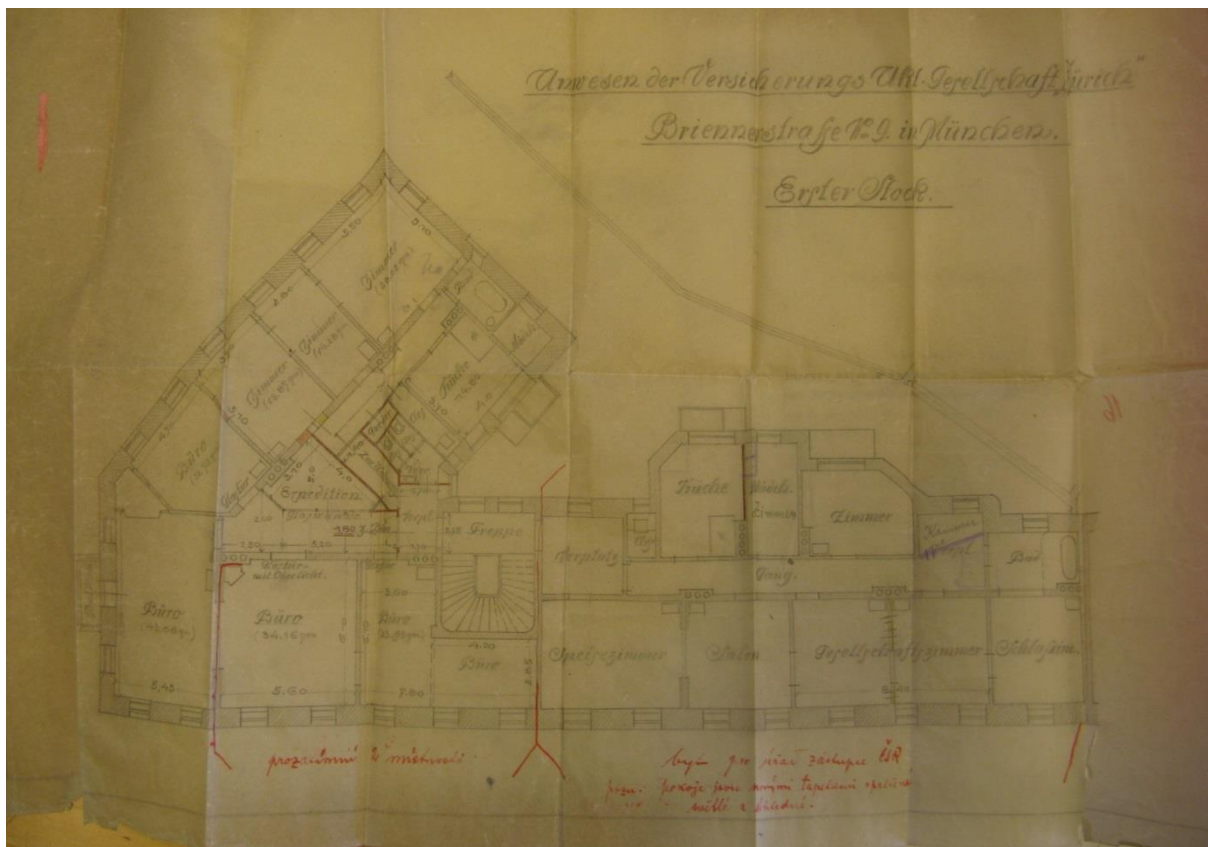
Příloha č. 1 - Plánek původních prostorů mnichovského konzulátu na Brienerstraße 9. V levé části jsou vidět dvě místnosti úřadovny a v pravé části pak byt přednosta.