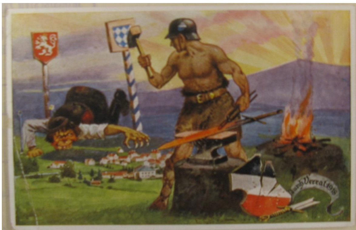
Příloha č. 4 - Propagandistická pohlednice spolku Deutsche Wacht: „Was Deutsch ist, soll Deutsch bleiben“ – „Co je německé, zůstane německé.“