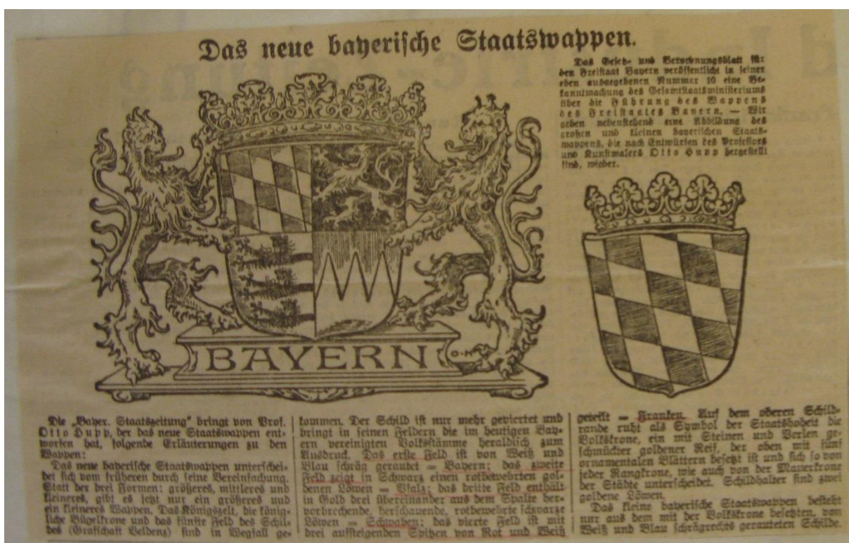
Příloha č. 2 - Státní znak Bavorska používaný od roku 1924.