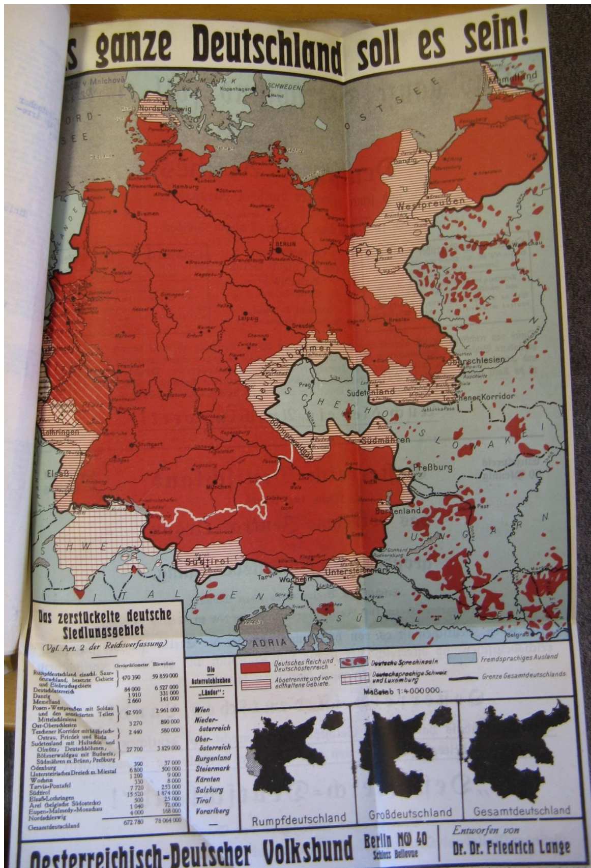
Příloha č. 5 - „Das ganze Deutschland soll es sein!“ - „Tak má vypadat Německo!“ Mapa spolku Österreichisch-Deutscher Volksbundu pro školy získaná pracovníky úřadu v Mnichově.