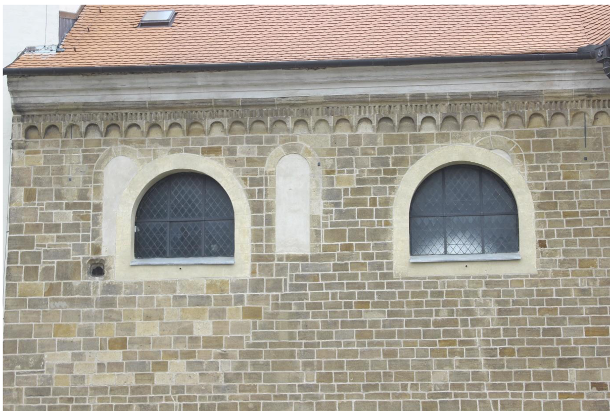
21. Třebíč, Bazilika svatého Prokopa.