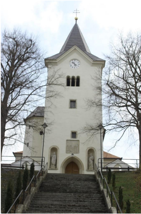
13. Bořitov, detail oken na věži kostela svatého Jiří, před 1580.