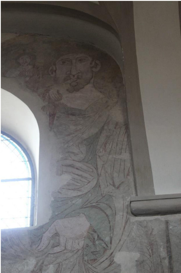
11. Bořitov, pozdně gotické nástěnné malby v blízkosti sanktuáře, před 1480.