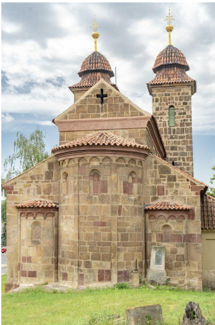
23. Německo, Hamersleben, Stavba kostela.