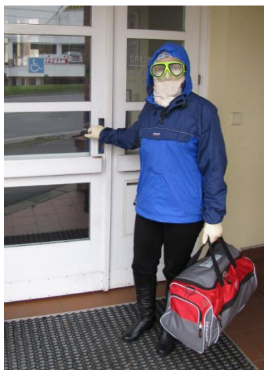
Obrázek 5. Improvizovaná ochrana celého těla.