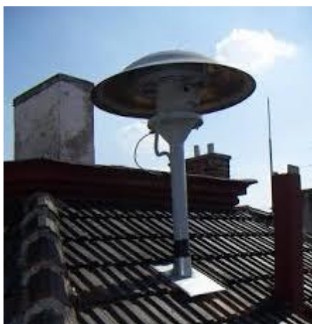
Obrázek 1. Rotační siréna ( https://www.haricom.cz/poplachove-sireny/ ).

Zvuk u rotačních sirén vzniká rozkmitáním vzduchové masy vhodně nastavenými lopatkami rotoru elektromotoru. Sirény jsou začleňovány do JSVV o minimálním výkonu 3 kW. Nejčastěji se využívá rotační siréna DS 977 s výkonem 3,5 kW. Jsou ovládány na dálku pomocí přijímačů na dálkové ovládání a tlačítka místního ovládání. K použití varování pomocí rotační sirény je nezbytná dodávka elektrického proudu (Kratochvílová, Kratochvílová, ml., & Folwarczny, 2013).