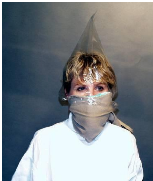
Obrázek 4. Improvizovaná ochrana hlavy

Improvizovaná ochrana je pouze dočasná a velmi omezená, slouží na několik minut a je vhodné urychleně opustit zamořený prostor nebo se přesunout do vhodného úkrytu (Doležel et al., 2014).