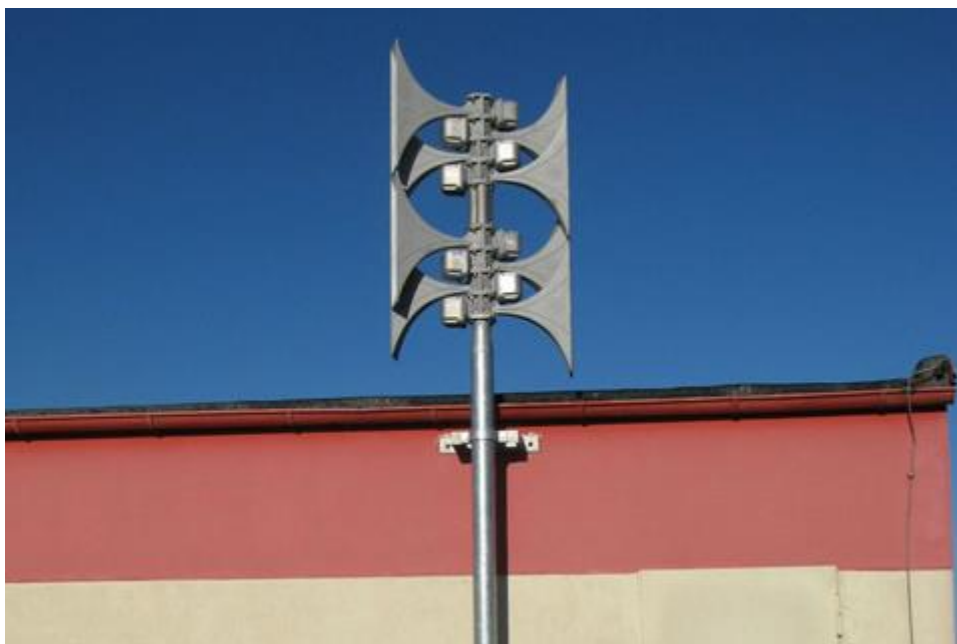
Obrázek 3. Elektronická siréna.