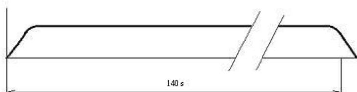
Obrázek 2. Zkouška sirén.

Pravidelně každou první středu v měsíci ve 12:00 probíhá na území celé České republiky zkouška sirén. Zkušební signál je provozován za účelem kontroly provozuschopnosti jednotlivých koncových prvků i celého systému JSVV. Je to trvalý tón, který trvá 140 sekund. Tón je doplněn verbální komunikací, jestliže se jedná o elektronické sirény a místní informační systémy.