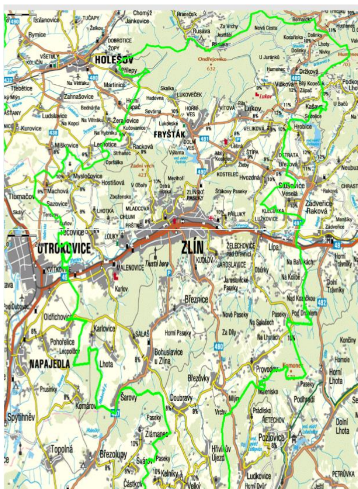
Obrázek 7. Mapa ORP Zlín (Informace od pracovníka Magistrátu města Zlína, 2020).