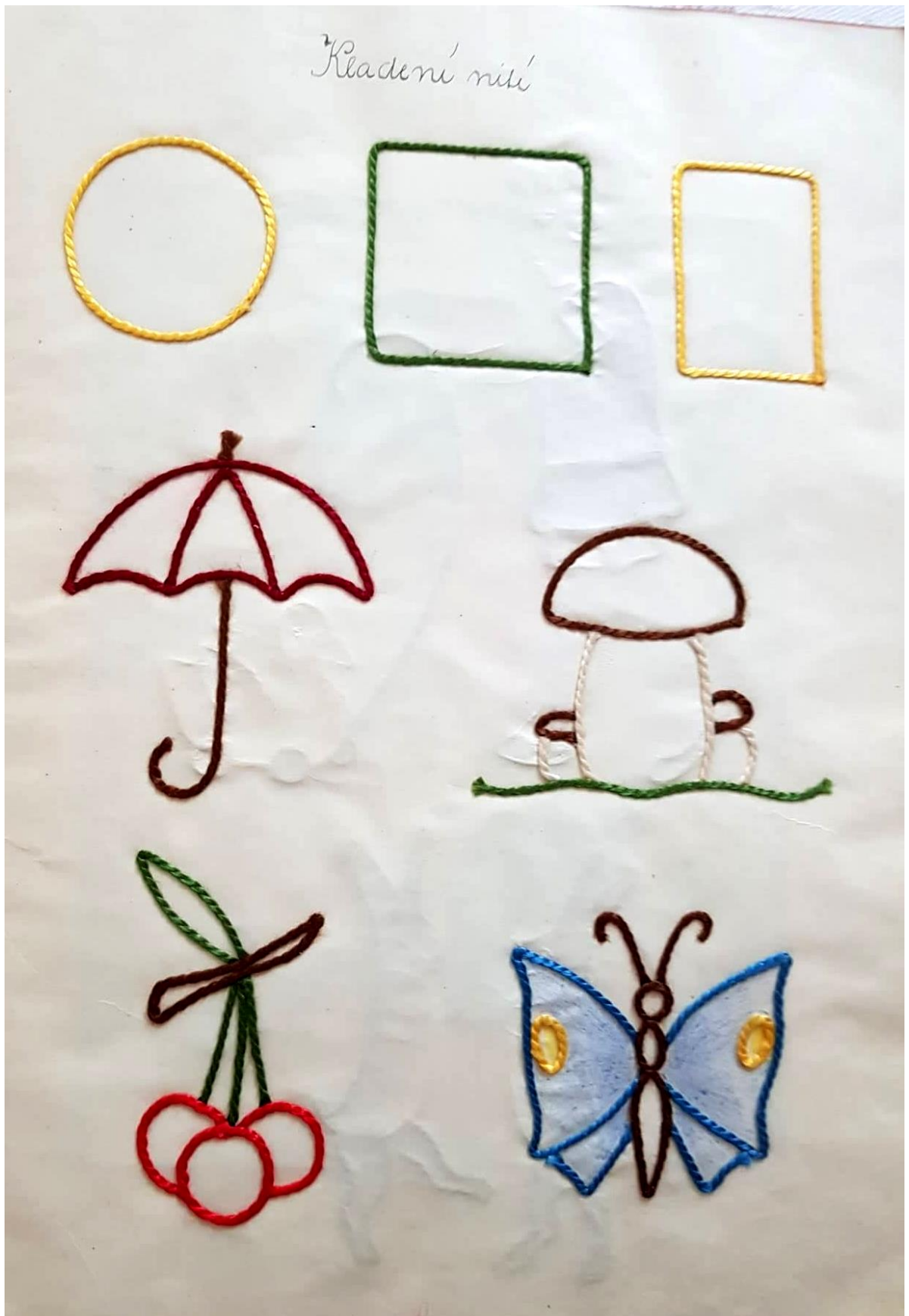
Obrázek 8: sešit Albíny Huškové