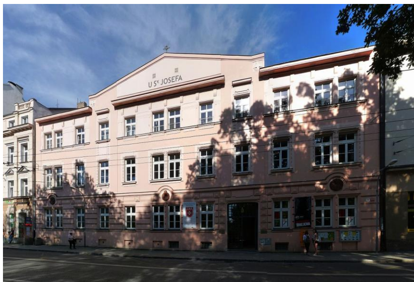
Obrázek 3: budova učitelského ústavu u SV. Josefa