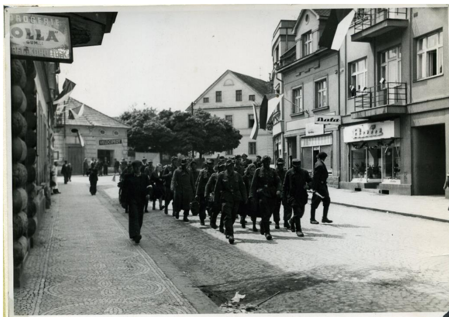
Obrázek 16. Odvod zajatých Němců