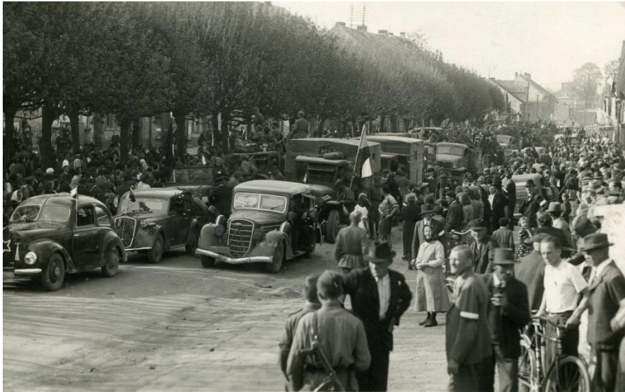
Obrázek 17. Osvobozování města