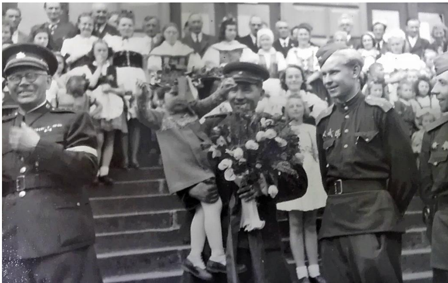
Obrázek 18. Vítání Rudé armády před Lázeňským hotelem