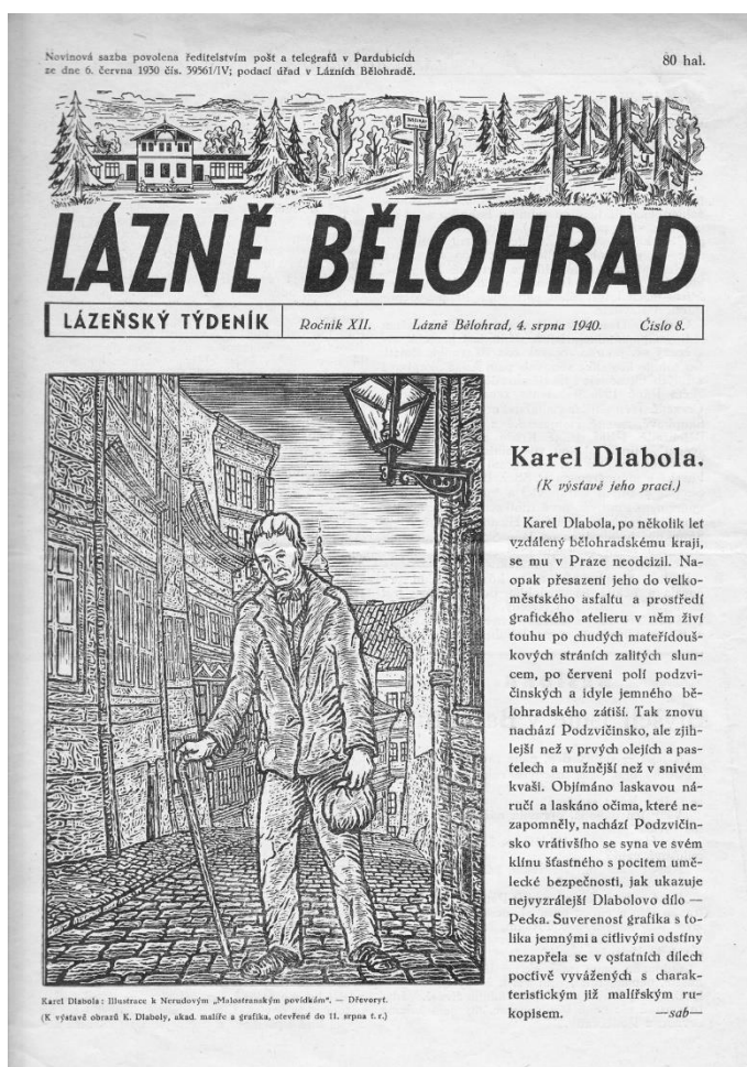
Obrázek 2. Titulní stránka Lázeňského týdeníku