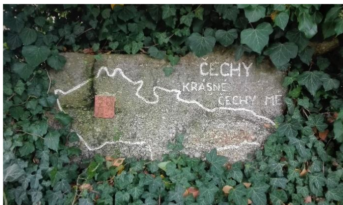
Obrázek 1. Kámen nalezený roku 1939 v lesích nad Bělohradem