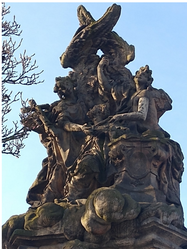
Příloha č. 4a: Apotheóza sv. Jana Nepomuckého.