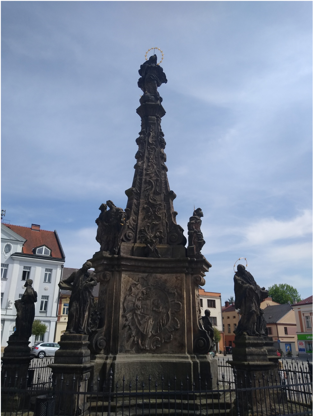
Příloha č. 6: Mariánský sloup.