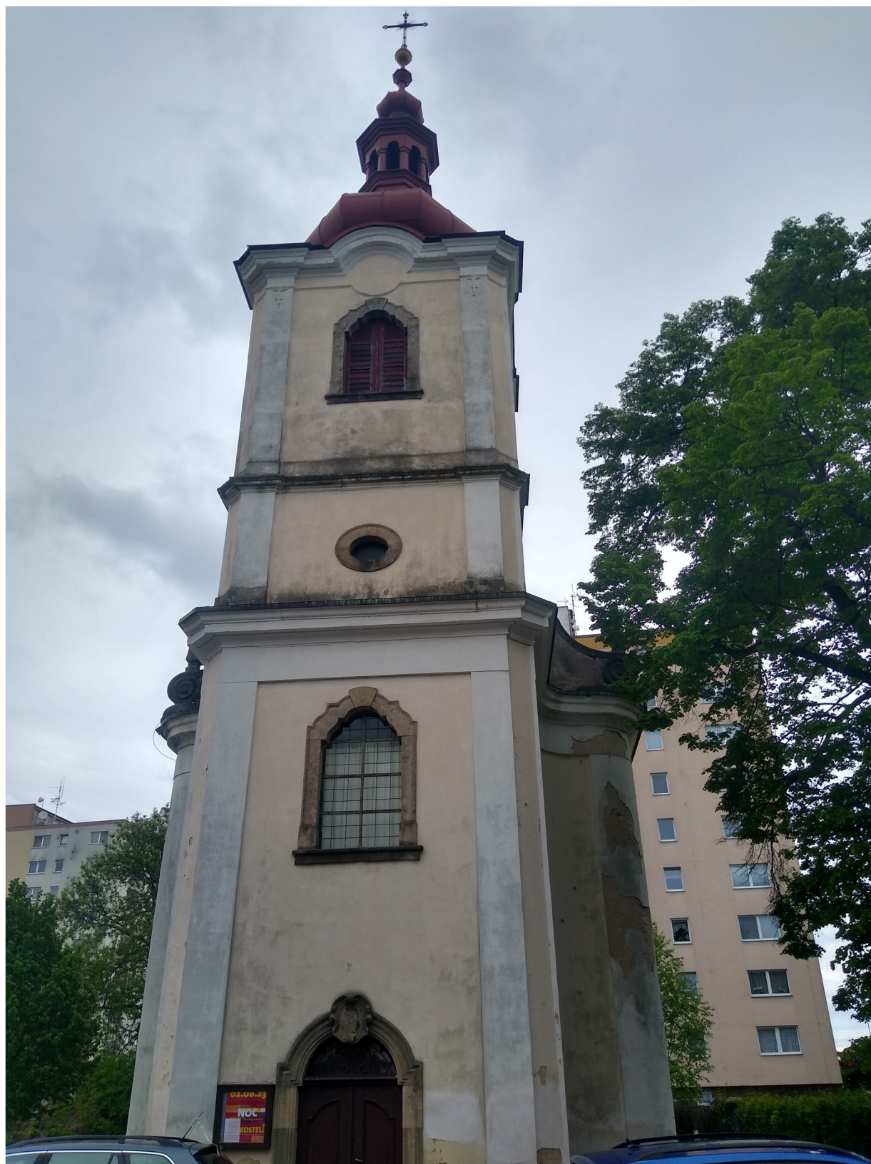
Příloha č. 5: Kostel Povýšení Svatého Kříže