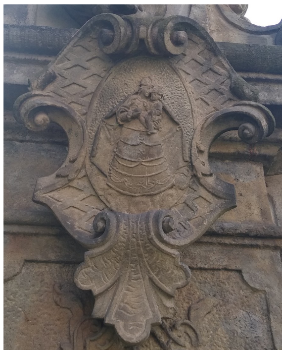
Příloha č. 4b: Ozdobný štítek s vyobrazením Panny Marie.