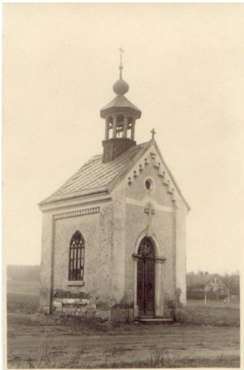
Příloha č. 7: Původní vzhled kaple sv. archanděla Michaela.