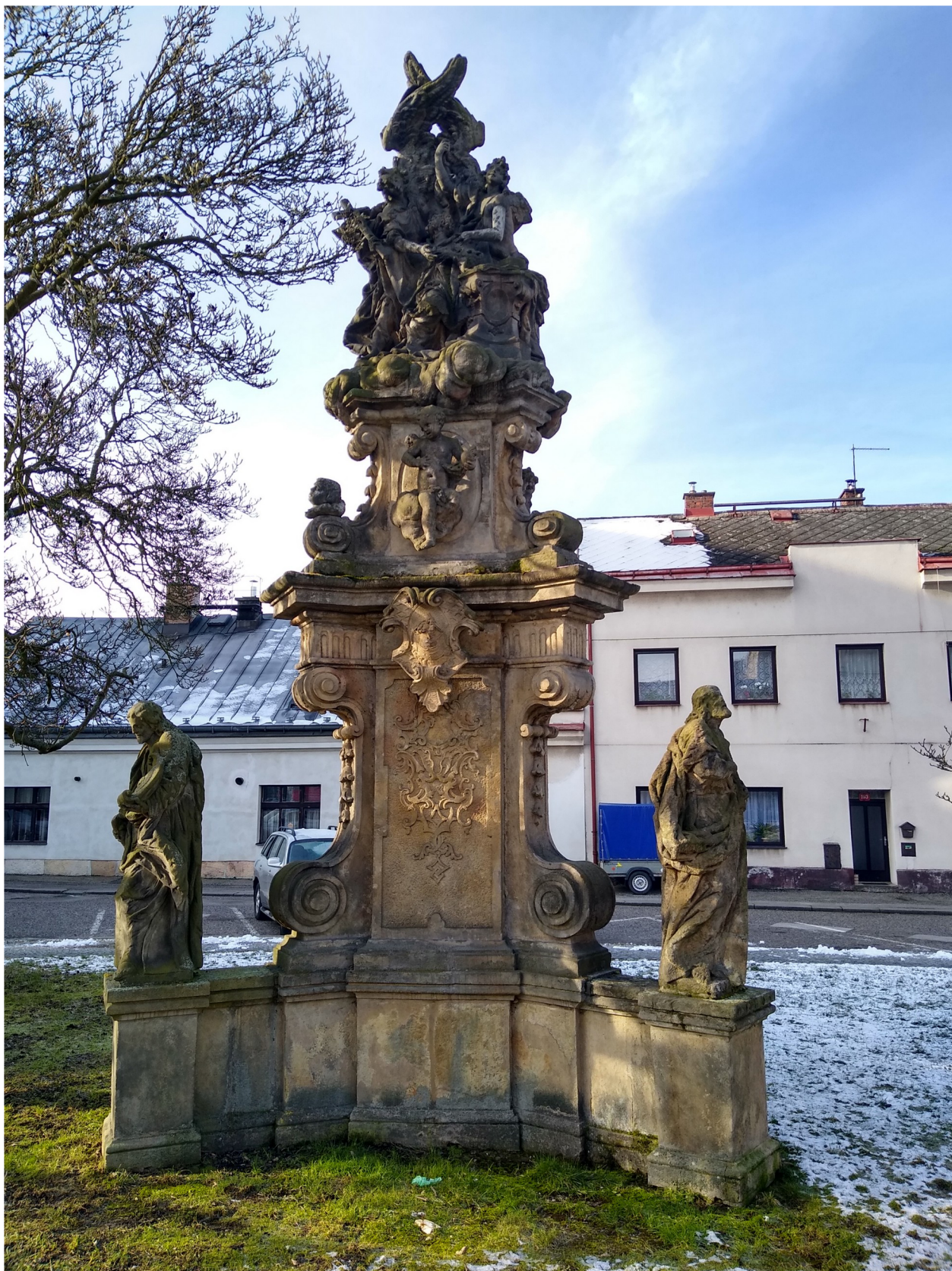
Příloha č. 4: Svatojánské oratorium.