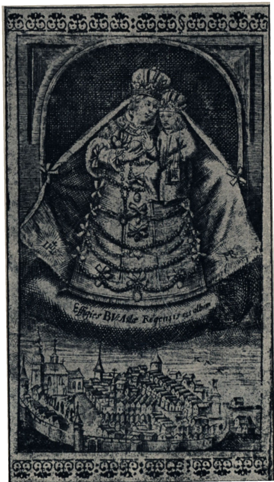
Příloha č. 3: Veduta města s vyobrazením Panny Marie.

(Antonín SCHULZ, Průvodce Dvorem n. L. , Dvůr Králové nad Labem 1921, obr.3.)