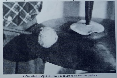
6. Čím silněji znející nástroj, tím opatrněji ho musíme používat.

Větší činely rozevzdujeme při počátečním muzicirování výhradně paličkami nebo podobnými předměty. Jeden z talířů se buď volně zavěsí na vhodný stojan, nebo se zvedne a drží levou rukou za řemínek, kdežto pravá ruka do něho tluče paličkou shora poblíž okraje (popřípadě pletacím drátem, hůlkou nebo tlukátkem, viz obr. 6). Rozevzdužený činel můžeme nechat vyznít anebo jej utlumit dotykem okraje.