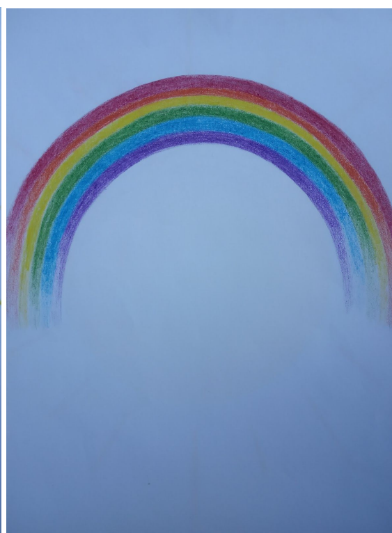
Obrázky k písni „Počasí“