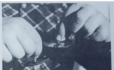
5. Raději však takhle!

Větší činely rozevzdujeme při počátečním muzicirování výhradně paličkami nebo podobnými předměty. Jeden z talířů se buď volně zavěsí na vhodný stojan, nebo se zvedne a drží levou rukou za řemínek, kdežto pravá ruka do něho tluče paličkou shora poblíž okraje (popřípadě pletacím drátem, hůlkou nebo tlukátkem, viz obr. 6). Rozevzdužený činel můžeme nechat vyznít anebo jej utlumit dotykem okraje.