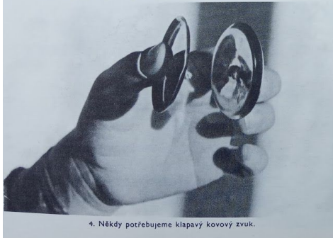
4. Někdy potřebujeme klapavý kovový zvuk.