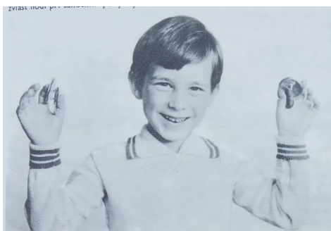
3. Hra na prstové činelky je docela zábavná, nemyslete!