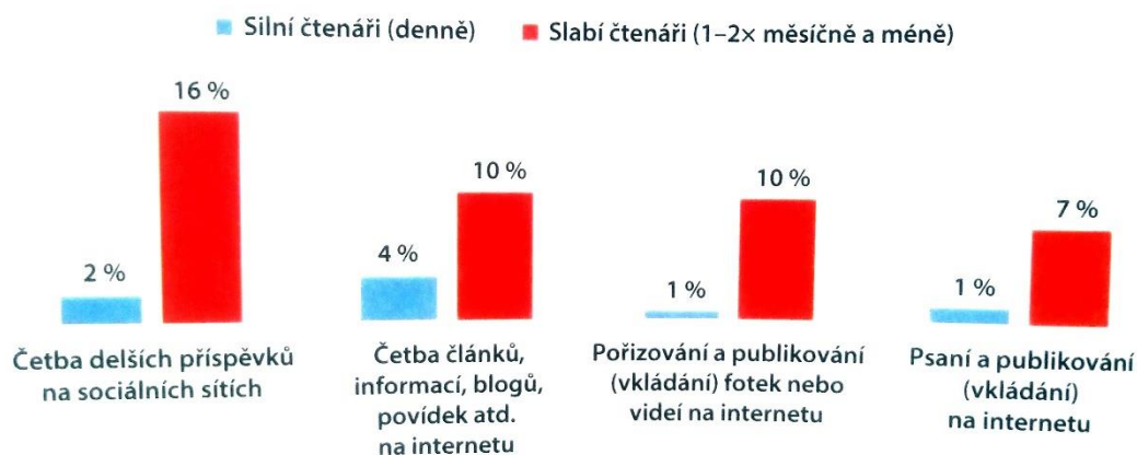
Graf 2.14 Denní aktivity spojené s četbou a publikováním na internetu — silní/slabí čtenáři. Děti 9–12 let, N=581

U dnešní mladé generace lze pozorovat změny v zájmech, například čtení knih je často nahrazováno digitálními prostředky a počet těch, kdo dávají přednost internetu s vzrůstajícím věkem stoupá. 82 V obrázku grafu níže „Graf 2.14- Denní aktivity spojené s četbou a publikováním na internetu“ 83 vidíme přímou souvislost mezi čtením a prací na internetu. Slabší čtenáři tráví na internetu podstatně více času.