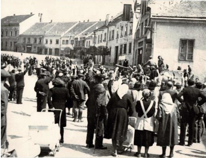
Príloha č. 5: Víťaní Rudé armády