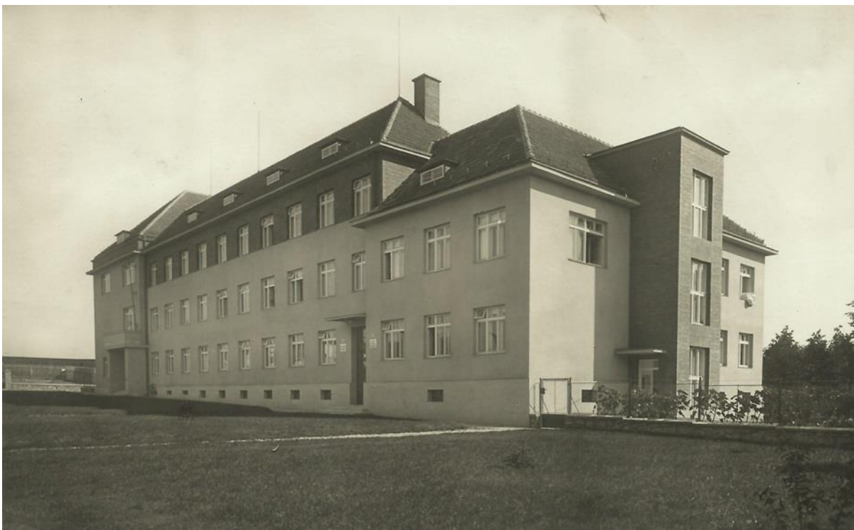
Príloha č. 2: Budova okresního úřadu