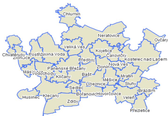
Obrázek 5 - Mapa - Obce MAS Nad Prahou