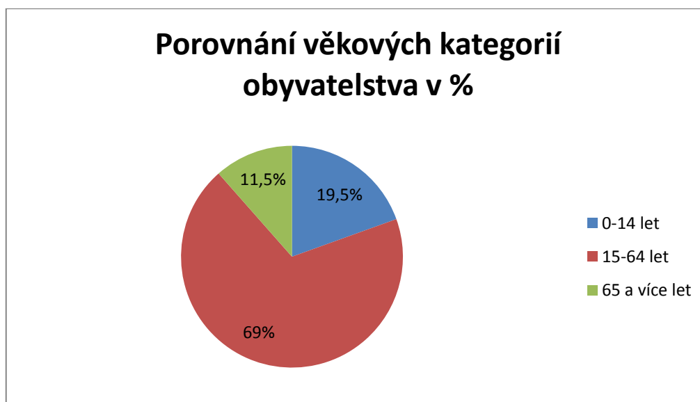
Obrázek 4 – Věková struktura mikroregionu v roce 2011