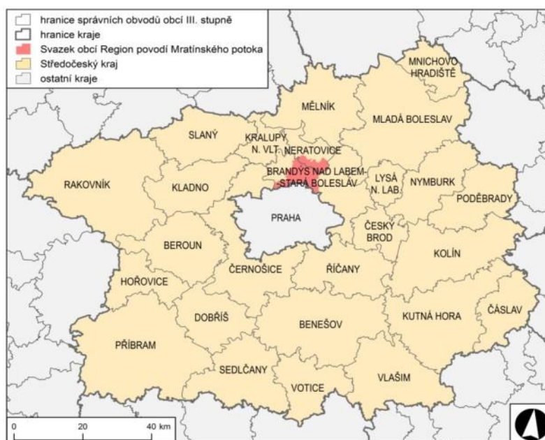
Obrázek 2- Mapa - Určení místa mikroregionu