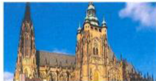
Katedrála sv. Víta Gotika

je z kámen a starší materiál je si z kámen