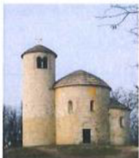
Rotunda sv. Jiří Románský sloh

Napište největší rozdíly mezi gotickou a románskou stavbou — použijte ilustrační obrázky