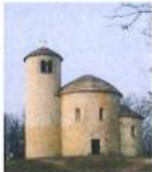
Rotunda sv. Jiří Románský sloh –

Napište největší rozdíly mezi gotickou a románskou stavbou – použijte ilustrační obrázky