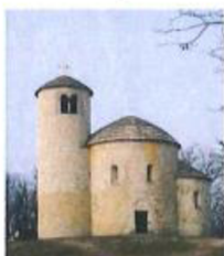
Rotunda sv. Jiří Románský sloh

Napište největší rozdíly mezi gotickou a románskou stavbou – použijte ilustrační obrázky