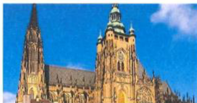
Katedrála sv. Víta Gotika

HEZČÍ, DRAŽŠÍ, OZDOBĚJŠÍ, VYŠŠÍ, PROSTORNĚJŠÍ