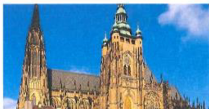
Katedrála sv. Víta Gotika