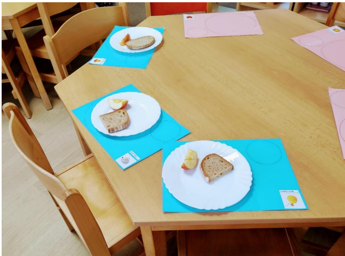
Obrázek č. 5 Montessori pomůcky