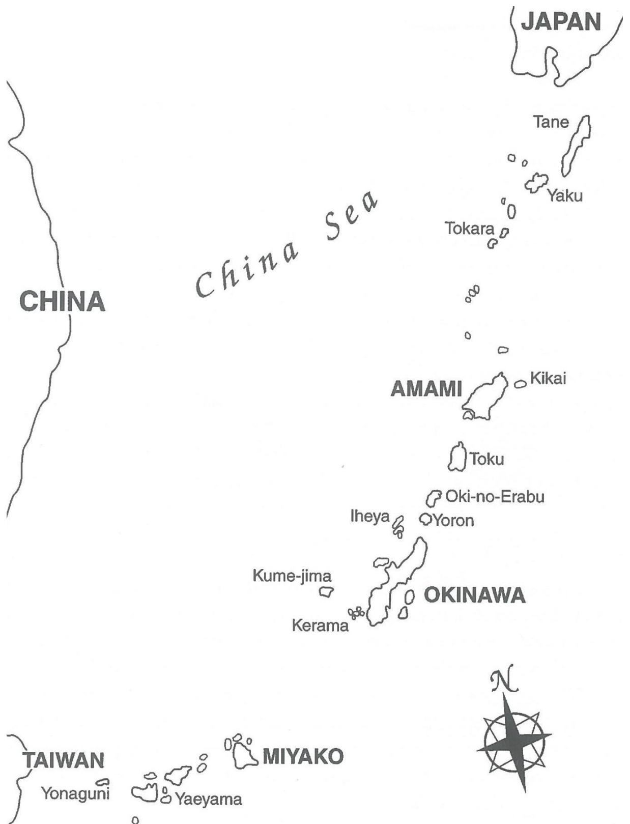
Obrázek 3: Království Rjúkjú (SMITS. Visions of Ryukyu... str. 4)