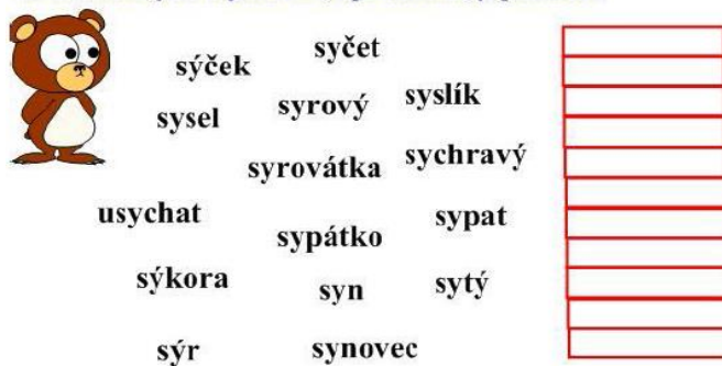
Obrázek 26 - Doplnovací cvičení pro interaktivní tabuli (PRÁCE S INTERAKTIVNÍ TABULÍ SMART Board. Užití tabule ve fázi procvičovací (fixační). kompetentniucitel.cz [online]. ©2013-2014 [cit. 2014-04-27]. Dostupné z: www.kompetentniucitel.cz/cms/get/file.php?id=307.)

Jistě jsi velmi chytrý a umíš vyjmenovaná slova. Medvěd Smíšek je někdy velký nešika. Jednou ráno se probudil, a jak byl rozespálý a měl chuť na med, rozsypal ve spížiřně velký pytel. Jaké to překvapení! Vypadala z něho nějaká slova. Poznáš, jaká to jsou slova, a pomůžeš mu je poskládat?