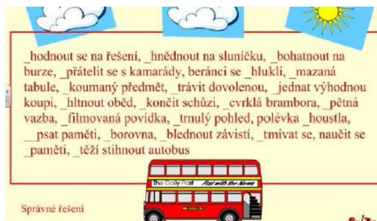
Obrázek 24 - Doplnovací cvičení pro interaktivní tabuli (PRÁCE S INTERAKTIVNÍ TABULÍ SMART Board. Užití tabule ve fázi procvičovací (fixační). kompetentniucitel.cz [online]. ©2013-2014 [cit. 2014-04-27]. Dostupné z: www.kompetentniucitel.cz/cms/get/file.php?id=307 .)