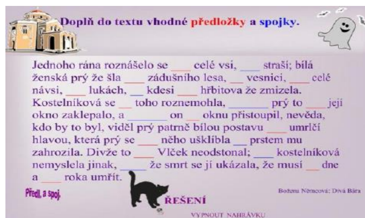
Obrázek 25 - Doplnovací cvičení pro interaktivní tabuli (PRÁCE S INTERAKTIVNÍ TABULÍ SMART Board. Užití tabule ve fázi procvičovací (fixační). kompetentniucitel.cz [online]. ©2013-2014 [cit. 2014-04-27]. Dostupné z: www.kompetentniucitel.cz/cms/get/file.php?id=307 .)